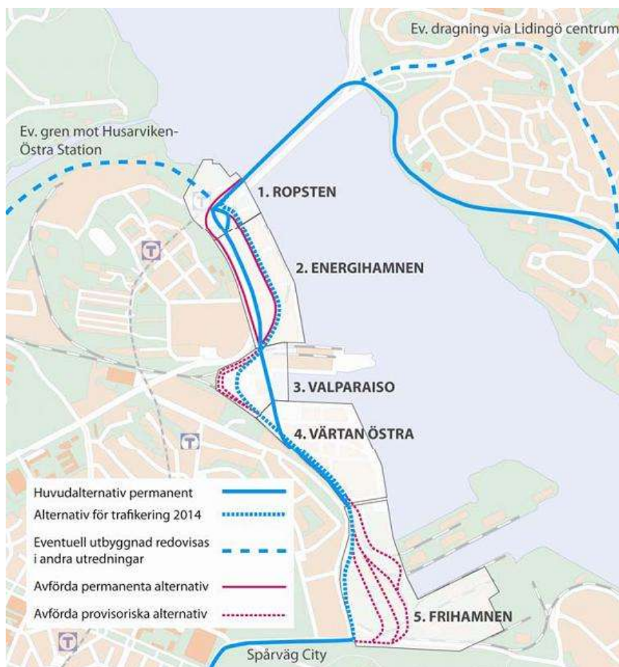
Föreslagen sträckning uppdelat på olika delsträckor. (Källa: SL)