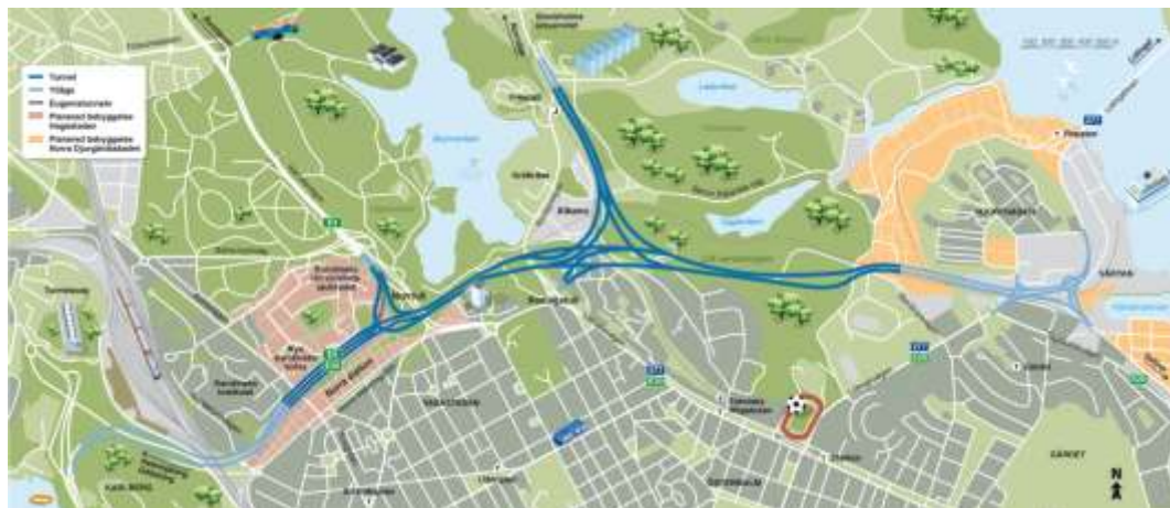
Figur 1. Översiktskarta

Öppnandet innebär en avlastning från biltrafik på flera av stadens gator i norra innerstaden. Nuvarande genomfartstrafik via Lidingövägen-Valhallavägen-Roslagstull och sedan mot Norrtull respektive Frescati, kommer att via tunnlar få en gen och effektiv passage. Framför allt kommer det att märkas att huvuddelen av den tunga trafiken till och från hamnen inte längre behöver passera via stadens gatunät. De gator som i första hand påverkas är Lidingövägen, Valhallavägen, Roslagsvägen, Cedersdalsgatan och Sveavägen mellan Sveaplan och Norrtull.