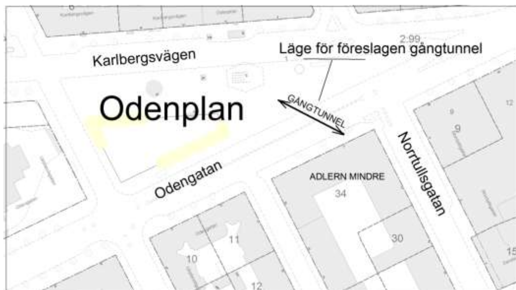
Studerat läge för gångtunnel under Odengatan, väster om Norrtullsgatan

I samband med pågående planering och byggnation av Citybanans nya station vid Odenplan har fördjupade analyser från stadens sida visat att det framledes kommer att finnas behov av förbättrad passagemöjlighet tvärs Odengatan. I det sammanhanget har aktualiserats möjligheten till anordnade av en gångtunnel under gatan, från Odengatans södra sida med anslutning direkt mot biljetthallen vilket skulle ge en gen och trafiksäker passage.