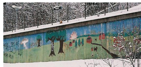
Landskap vid tunnelbanan i Rågsved

Invid centrumanläggningen i Rågsved som ligger nära tunnelbanestationen Rågsved finns två större abstrakta stora målningar. De har inte förändrats sedan 2004. Fotona på nästa sida har tagits under senhösten 2005.