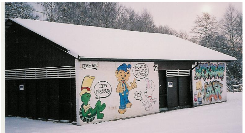
Byggnaden nära badstranden vid Farsta Gård. Byggnaden är relativt stor – runt 12 x 10 meter.

Långsidorna har målningar. De gjordes för många år sedan. Där förekommer en del seriefigurer i trevliga utföranden. Gavlar-na har mörk träpanel. Målningarna har inte blivit nerkladdade av klotter. Inte heller byggnadens gavlar.