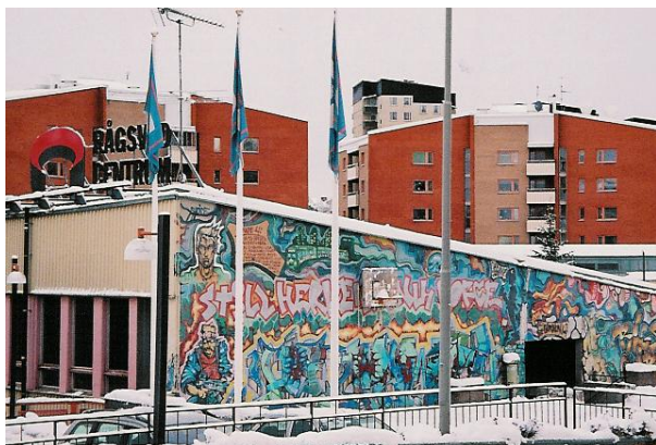
Målningar i närheten av Rågsveds centrum

Målningar av de slag som förekommer på de tre fotona från Rågsveds centrum har inte dagvandrararna påträffat på andra håll i närpolisområdet.