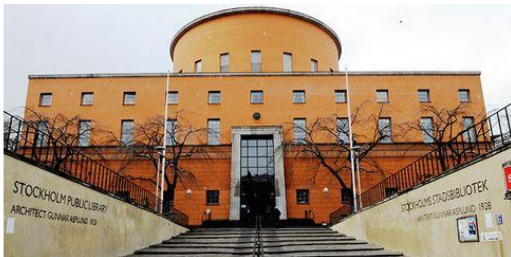
Figur 5 Stadsbibliotekets huvudentré

Om länsstyrelsen har godkänt planen kan åtgärder som ligger i linje med denna hanteras utan länsstyrelsens tillståndsprövning.” Ett ytterligare förtydligande av anläggningens kulturhistoriska värden kan regleras med skydds- och varsamhetsbestämmelser i en eventuell ny detaljplan, om detta blir aktuellt.