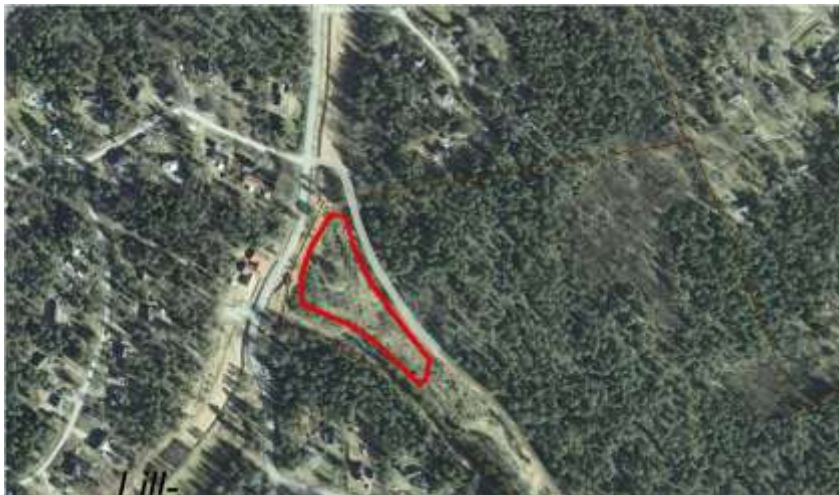
Figur 2. Ortofoto: Röd markering visar planområdet.

Fastighetsägaren har tidigare ansökt om förhandsbesked för att få avstycka två större områden för nya större hus (Dnr 818/2008). Ärendet är avslutat hos BMK med avslag.