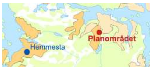
Figur 1. Översikt: Röd markering visar planområdet

Planenheten anser att planarbetet kan påbörjas, men att planläggning och exploatering bör ske på enskilt initiativ.