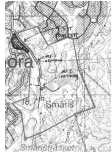
Figur 3. Förslagskiss.