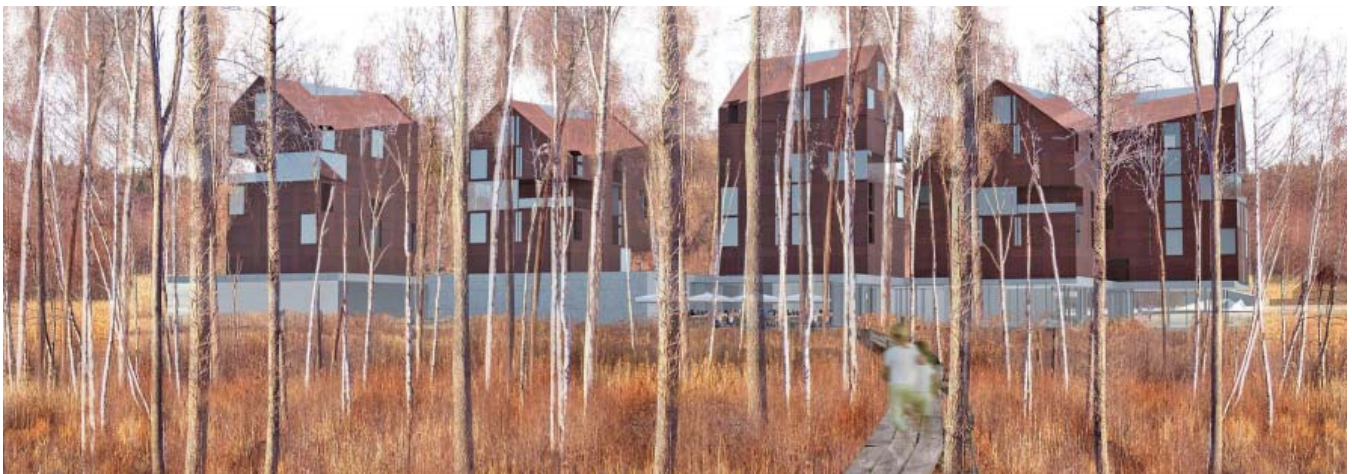
Perpektiv från spång vid Siggesta träsk. illustration och modell: tegnestuen vandkunsten

Hotellet får ett spännande och varierat uttryck som ändå anpassas väl till omgivande kulturlandskap.