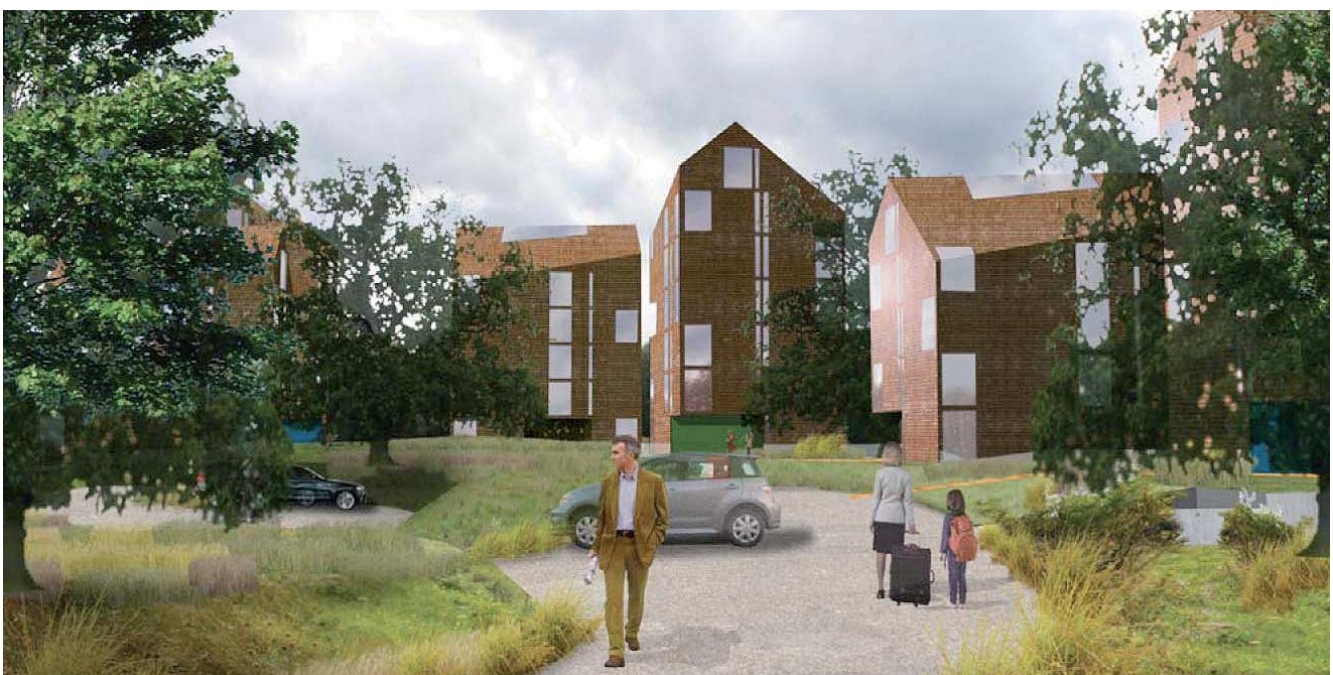
Perspektiv över hotellet från parkeringsplatsen framför. illustration och modell: tegnestuen vandkunsten

Fönstersättning i huvudsak enligt illustration nedan