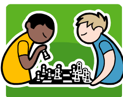
Barn och Unga