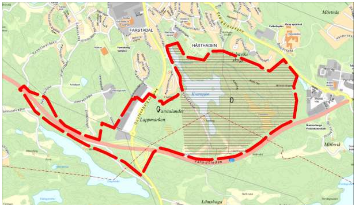
Föreslagen utredningsområde, naturreservatet skrafferat.

Efter möten med intressenterna och interna möten hos samhällsbyggnadskontoret har projektets målsättning vuxit fram.