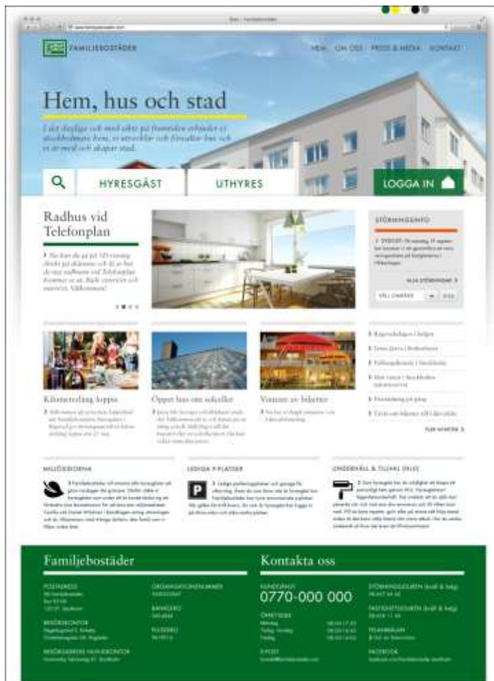
Skiss ny startsida.