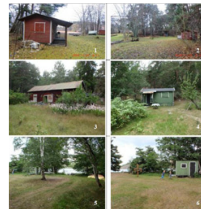
Befintlig bebyggelse inom fastigheterna Mörtnäs 1:12 (bild 1-3) och Mörtnäs 1:68 (bild 4-6)

Längs strandlinjen i öster finns ett antal mindre stugor som fungerar som fritidshus.