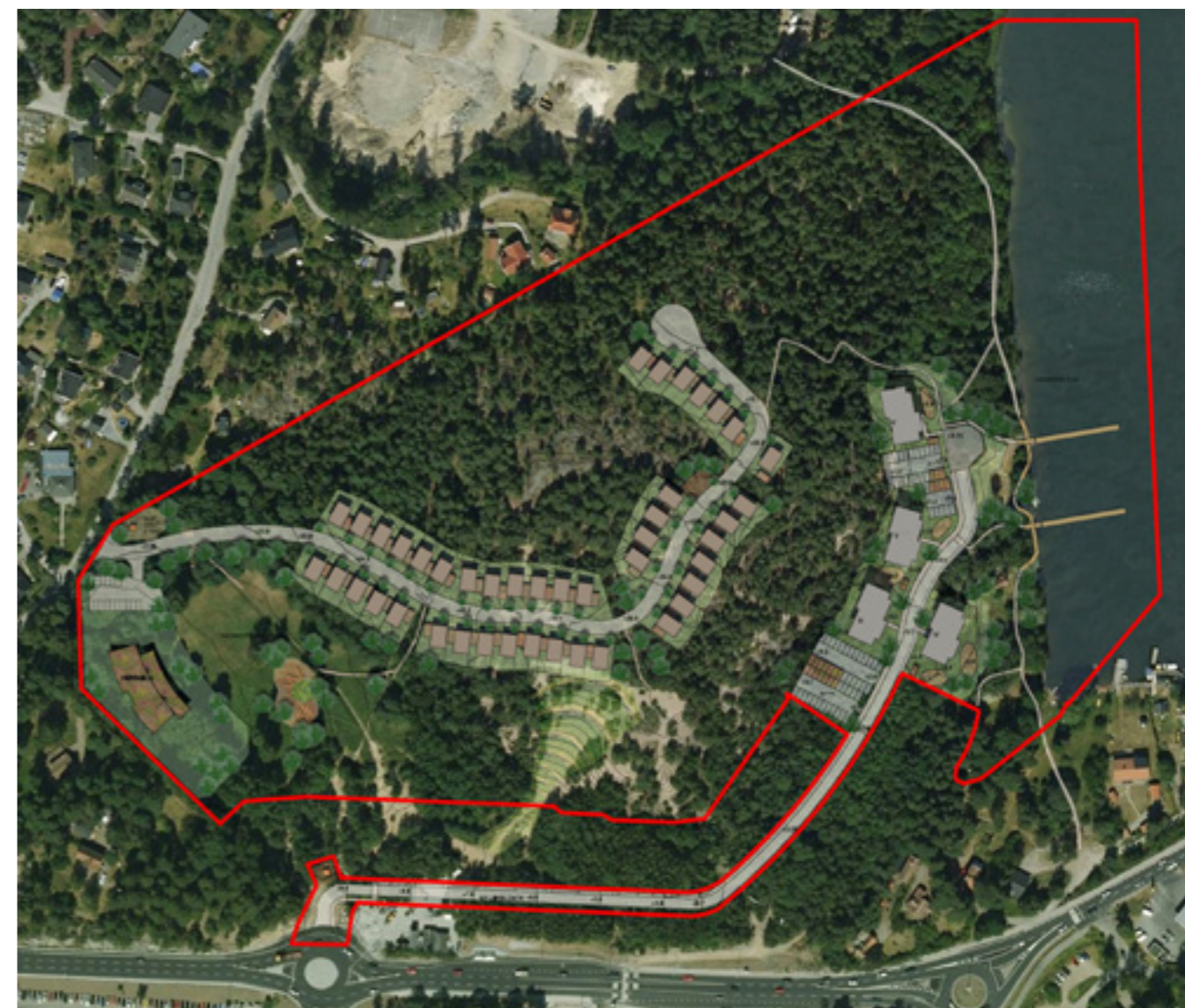
Illustration av föreslagen bebyggelse av området

På den västra delen av den öppna marken vid "Mormors ängar" föreslås en tomt för en ny förskola.