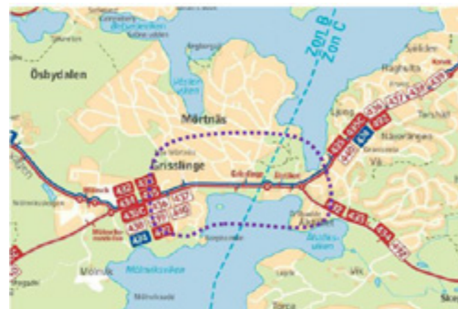
Busslinjer med hållplatser

Planområdet har ett bra läge med avseende på kollektivtrafik. Söder om planområdet finns flera hållplatser som trafikeras av busslinjer som kopplar ihop området med övriga delar av kommunen. Utöver målpunkter inom kommunen finns även motorvägsbussar in till Slussen i Stockholm med restid på 30-40 min beroende på busslinje. Turtätheten till och från Stockholm är hög, och mellan kl 7 och 8 avgår så många som 14 bussar mot Slussen.