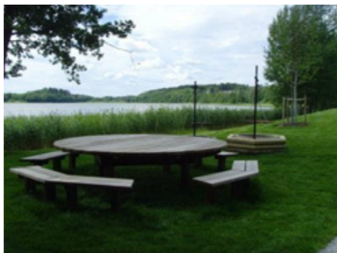
Exempel på möjlig anläggning i anslutning till Värmdöleden