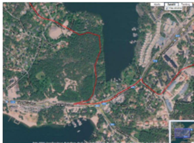
Röd linje visar Värmdöledens sträckning

För rekreation finns även Värmdöleden, en vandringsled, som löper genom områdets östra del. Vid Grisslingen söder om planområdet finns en badplats och en scoutstuga. Norr om planområdet håller Värmdö jolleseglare till.