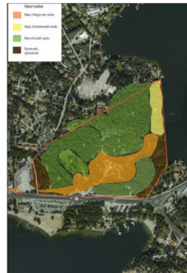
Naturvärden inom och i anslutning till planområdet

Naturmiljöerna av kommunalt intresse utgörs av en lövdominerad strandskog med rik förekomst av död ved, vilket utgör livsmiljö för flera skyddsvärda moss- och fågelarter. De lokalt intressanta miljöerna utgörs av barrskogar, Mormors Ängar, samt en yngre lövskog.