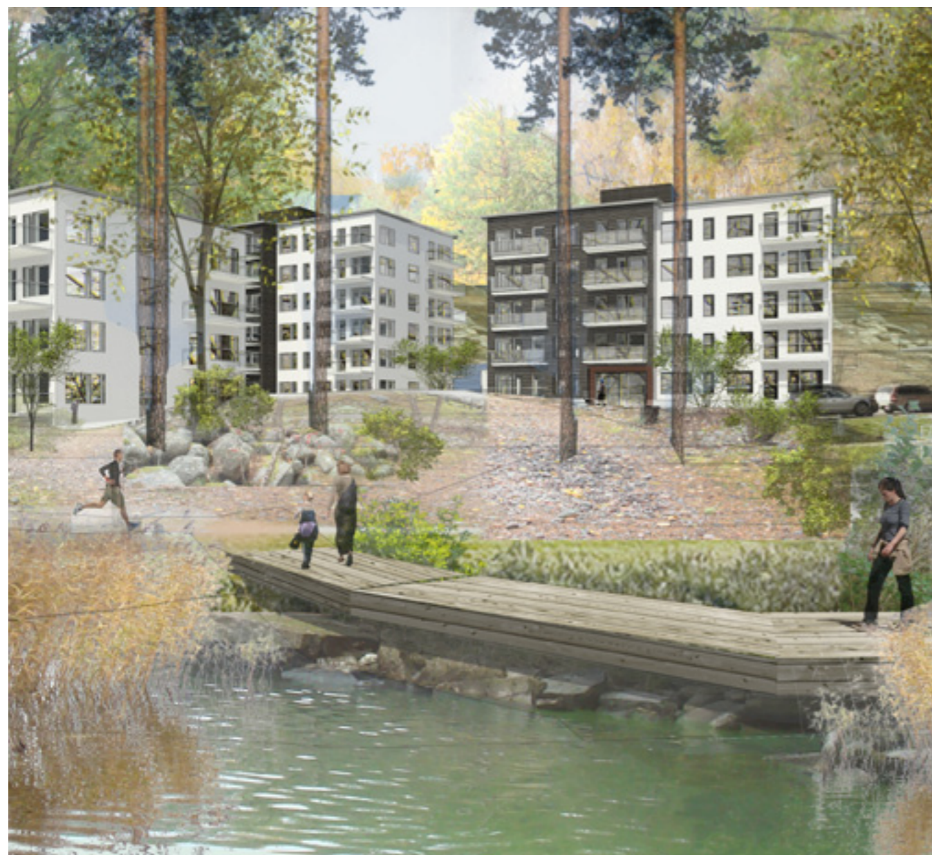
Illustration av föreslagen bebyggelse, flerbostadshus.