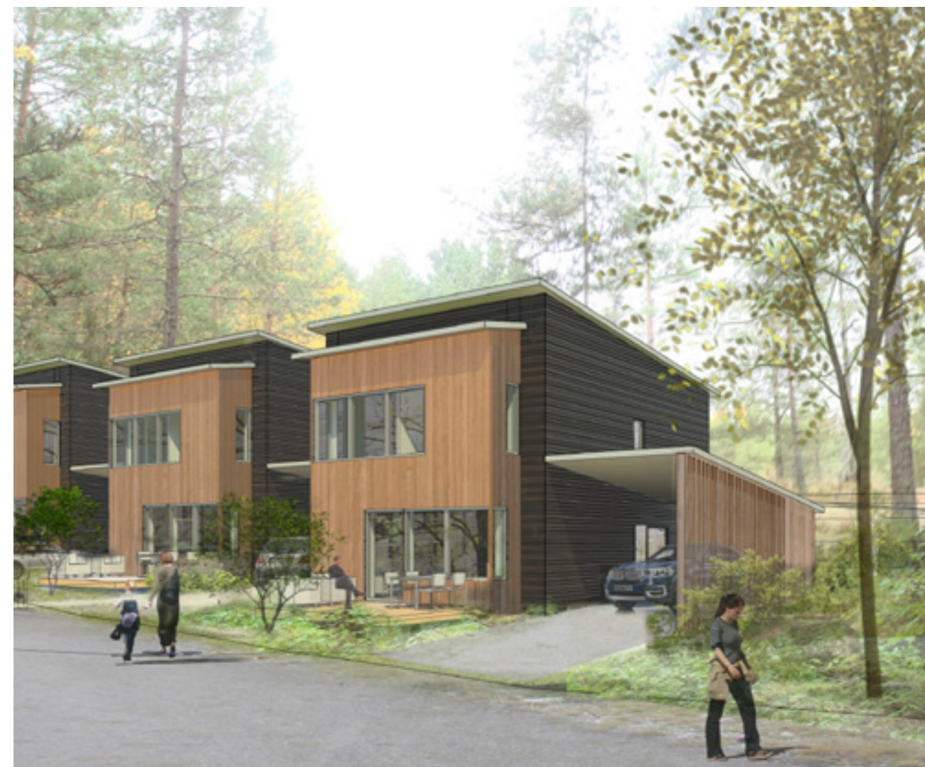
Illustration av föreslagen bebyggelse, småhus

Gårdarnas markbehandling anpassas och integreras till omgivande natur. Naturliga material som trä, sten och betong, anpassade till fasadernas kulörer, används kring uteplatser och lek. Planteringar med buskar, strandgräs, nya träd och solitärbuskar bör ge en vacker och omväxlande blomning. Mellan husen får man en fin solexponering och utblickar mot grönska och vatten.