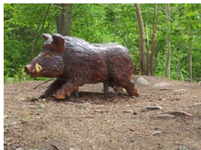
Exempel på naturlekplats

Vid Torsbyfjärden planeras en fartygsbrygga för framtida båttrafik samt bryggor för småbåtar för de boende inom området.