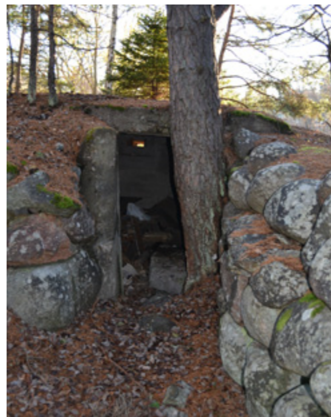
En av skyttegravarna i området

I planområdets norra del finns lämningar i form av delvis stensatta, överväxta skyttegravar från tiden för första världskriget. Syftet med anläggningen i Östra Mörtnäs var sannolikt att skydda förbindelserna från Värmdölandet över Gustavsberg in mot Stockholm. Det finns inga byggnader av kulturhistoriskt värde inom planområdet.