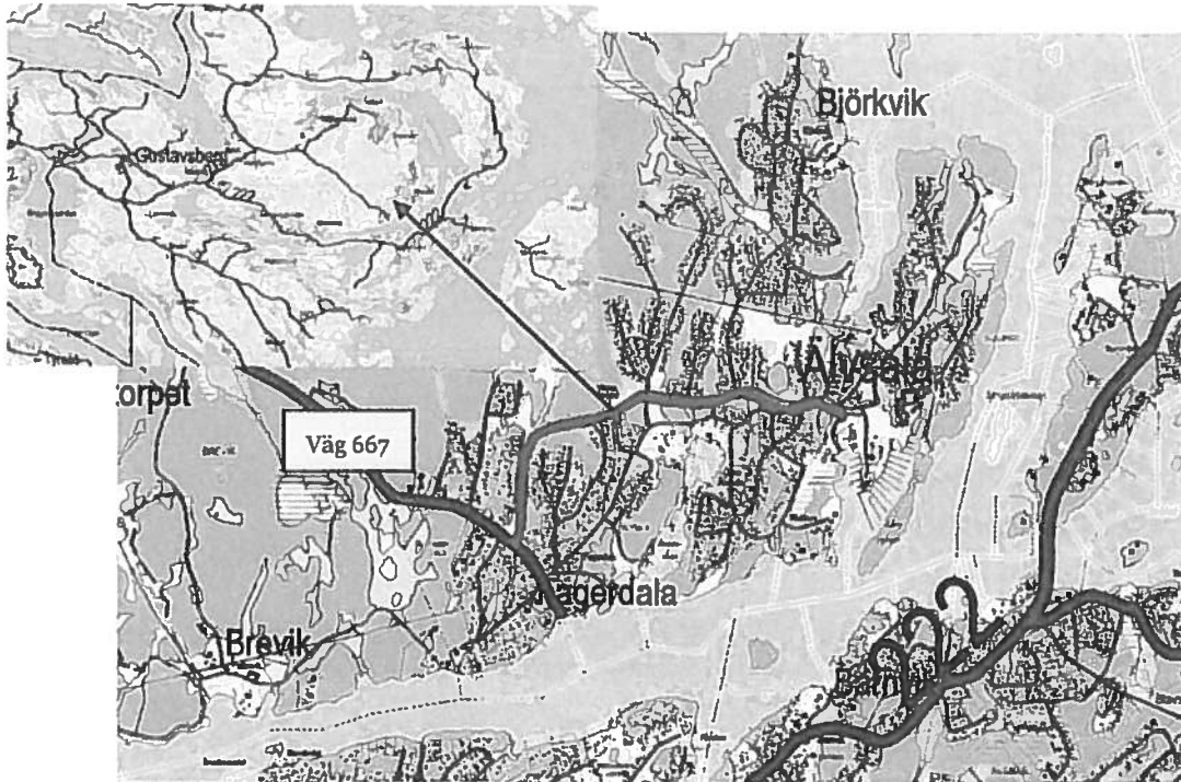
Illustration 1. Bullandövägens läge