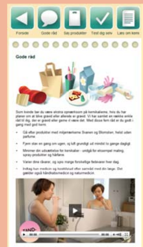
Mobilapp för blivande föräldrar från Danmarks miljöministerium och miljöstyrelse

Två goda exempel på information från nationella myndigheter till småbarnsföräldrar m fl.