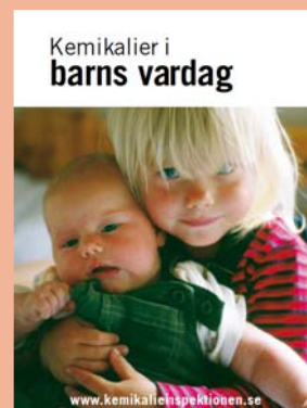
Skrift från svenska Kemikalieinspektionen