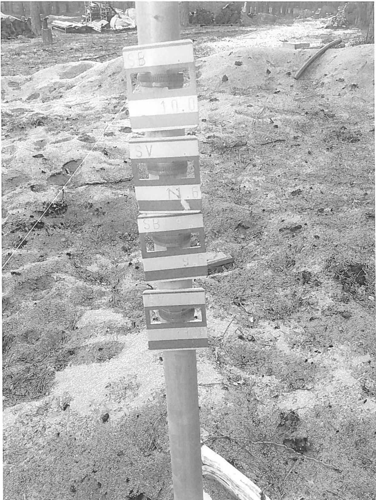
Stolpe vid tomtgräns