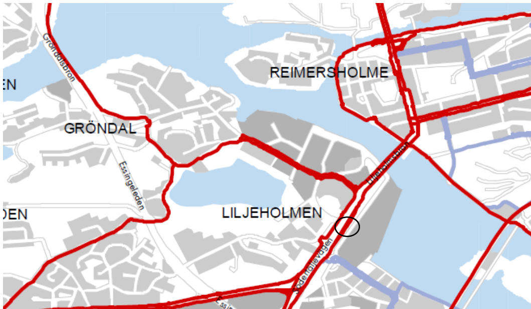
Figur2. Projektets placering på, det i cykelplanen utpekade, pendlingscykelstråket

Platsen är redan idag hårt ansträngd och många som passerar platsen känner sig otrygga och vill se att platsen anpassas till den rådande trafiksituationen.