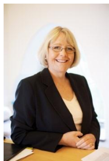
Irene Svenonius Stadsdirektör

Även omvärlden förändras. Påverkan från omvärlden ökar snabbt dels genom en ökande konkurrens om investeringar, kunskap och kapital, dels i form av ett snabbt ökande informationsflöde, import och influenser från omvärlden. Dessa allt snabbare förändringar behöver staden ha kunskap om och hela tiden anpassa sig till för att kunna ge medborgarna en så bra service som möjligt. Under ett par år har vi brett inom staden – på kommunfullmäktiges uppdrag - arbetat med att revidera Vision 2030 – Ett Stockholm i världsklass. Hör gärna av dig med Dina synpunkter på e-post till: vision2030.slk@stockholm.se . Du kan läsa mer på www.stockholm.se/vision2030 .