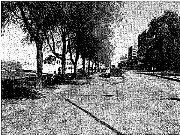
Grusplan Söder Mälarstrand kaj 25

Söder Mälarstrand är som ett vykort över Södermalm och Stockholm. Kajerna och särskilt den västra delen är en omtyckt hälsopromenad. I närheten ligger några av västra Södermalms mest omtyckta grönområden, Långholmen, Tantolunden och Drakenbergsparken. Året runt idrottare, turister och flanörer använder promenadstråket längs kajen även för en uppfriskande promenad längs Riddarfjärdens vattenrum. Vänsterpartiet vill göra Västra Söder Mälarstrand till en grönare och ännu hälsosammare promenadsträcka.