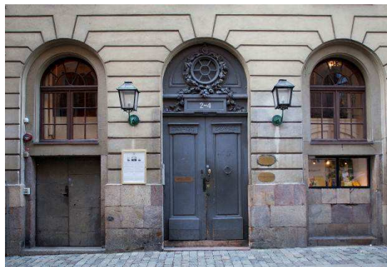
En snidad port mot Källargränd är, liksom de uppställda och dekorerade portarna mot Stortorget, välbevarade från byggnadens uppförande. Med sina snidade druvklasar markerar den ingången till krogen Börskällaren, borta sedan länge