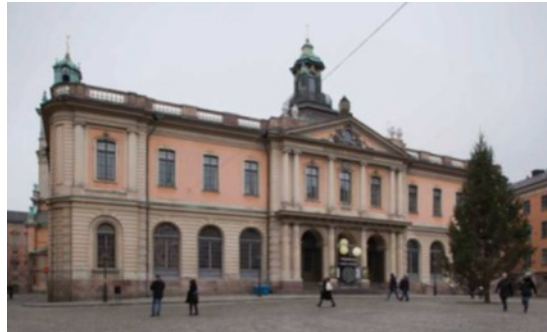
Vy från Stortorget. Börshusets exteriör är i huvudsak intakt från uppförandetiden på 1770-talet.