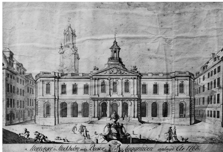
Börshuset vid Stortorget efter en tuschlavyr av Erik Palmstedt.

Rådstugan 1, Börshuset, utgörs av ett eget kvarter och ligger i fonden på Stortorget i Gamla Stan. Byggnaden markerar Stockholms medeltida centrum i närheten av kungliga slottet och Storkyrkan. Stortorget har sedan senmedeltiden varit stadens mest betydande plats för försäljning av varor. Det tidigare rådhuset låg sedan 1200-talet vid Stortorget norra sida. Behovet att lösa frågan om en särskild byggnad för handel och ett nytt rådhus påbörjades på 1600-talet. Flera arkitekter ritade olika förslag. Valet av arkitekt föll till slut på arkitekten och bygglédaren Erik Palmstedt. Byggnationen påbörjades år 1768. Börshuset har både rokokons rundade former och klassismens formspråk. Materialen valdes med tanke både på ekonomi och hållfasthet. Nya metoder och byggnadsmaterial prövades i byggnationen. Byggnadens höjd och placering studerades särskilt i förhållande till platsens form och storlek.