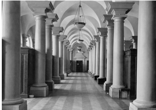
Fria förhandlingssalen 1923.

Rum och salar försågs med inredningar, dekor och snickerier. Fest- och börssalarna fick påkostade inredningsdetaljer som förgyllningar, speglar samt uttrycksfulla kolonner och pilastrar. Först 1776 togs byggnaden i bruk. När byggnaden var färdig inrymde den lokaler för börshandeln, olika försäkringskontor, stadsfullmäktige, bemedlingskommissionen, borgerskapets äldste och i östra delen restaurangen Börskällaren. Högst upp fanns redan då två bostadslägenheter. Börshuset är i huvudsak intakt från byggnadstiden med ett fåtal nytillskott och ändringar. När stadsfullmäktige flyttade till stadshuset på 1920-talet flyttade Svenska Akademien och Nobelbiblioteket in. När börsen lämnade byggnaden i början av 2000-talet flyttade Nobelmuseet in.