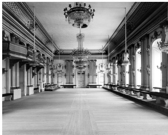
Stora börssalen 1896.