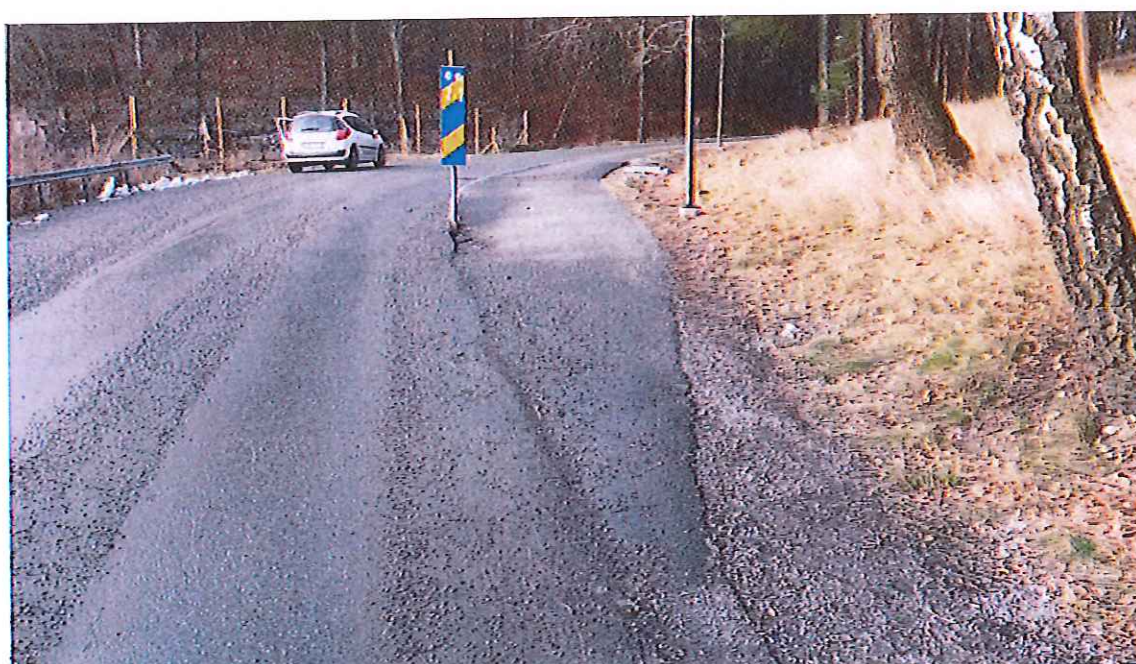
efter ca 100 meter börjar gångbanan