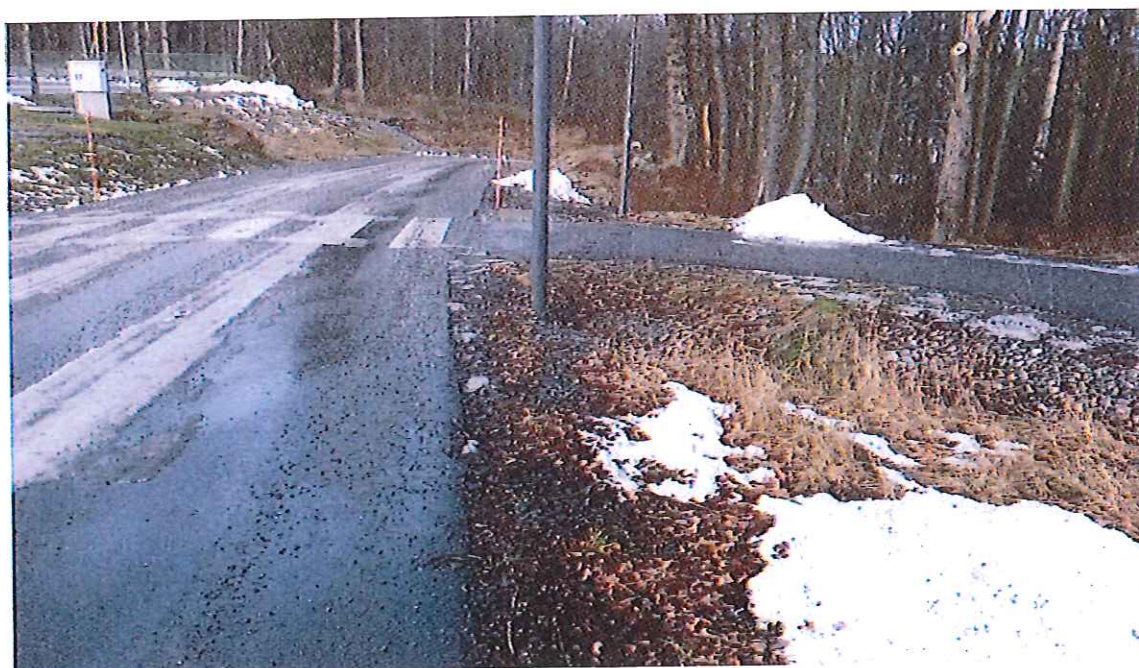
gångbanan upphör vid ridstallet