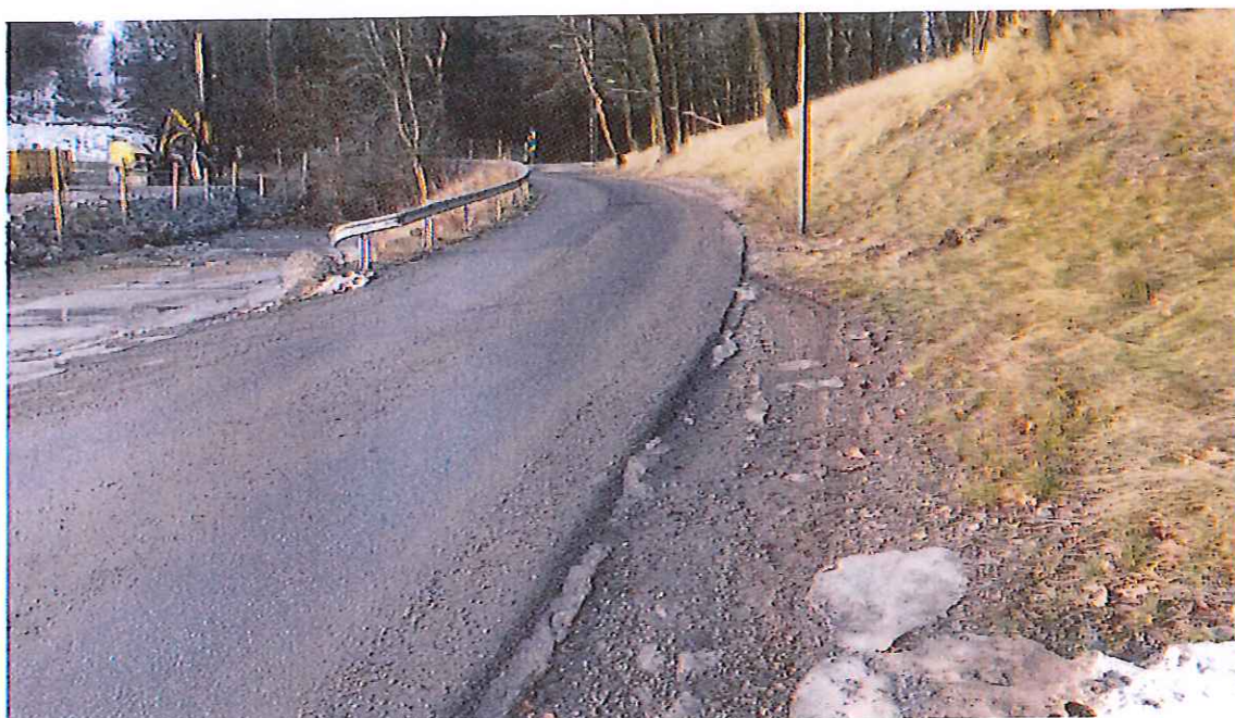
I början av vägen saknas gångbana. Här är Sättravarvsvägen så smal att bilar inte kan mötas.