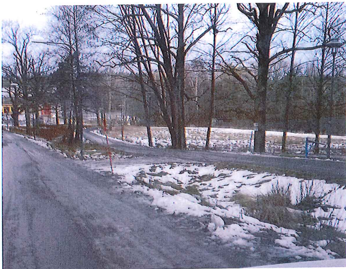
här är gångbanan (t.h.) mycket bra och helt separerad från körbanan (t.v.)