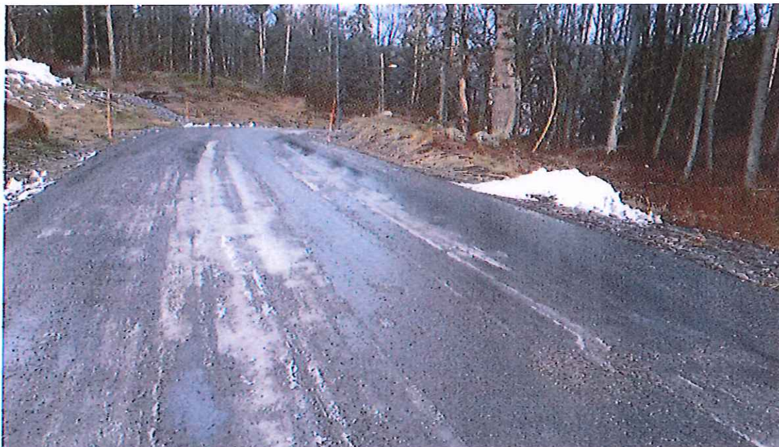
de sista hundra metrarna ned till varvet saknas gångbana