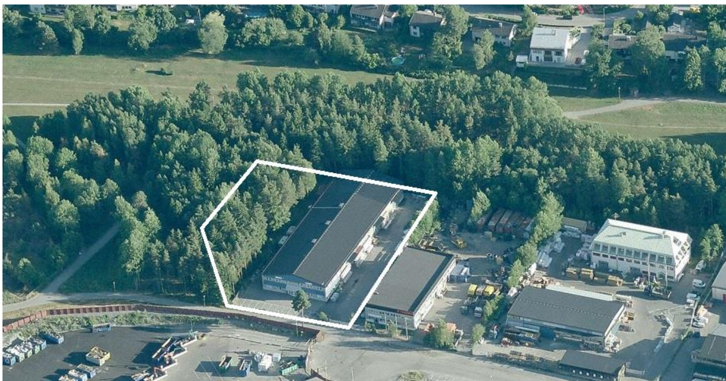
Flygbild från norr med planområdet markerat i vitt.

Området som avses för tillköp och exploatering är 1288 kvm stor och ingår i en del av Petterboda parkstråk, ett naturområde som fungerar som spridningskorridor för växter och djur, grön buffert samt visuellt skydd mellan Petterboda verksamhetsområde och intilliggande bostadsområden. Det aktuella området består av skogsmark med företrädesvis gran, björk, asp och större tallar som dominerande trädarter. Den mark som föreslås för utbyggnad av verksamhet bedöms inte vara av särskilt känslig karaktär, men är viktig då den fungerar som grön buffert och visuellt skydd. En av förutsättningar vid genomförandet av planförslaget är att den nya bebyggelsens uppförande skall minimeras och kompenseras för.