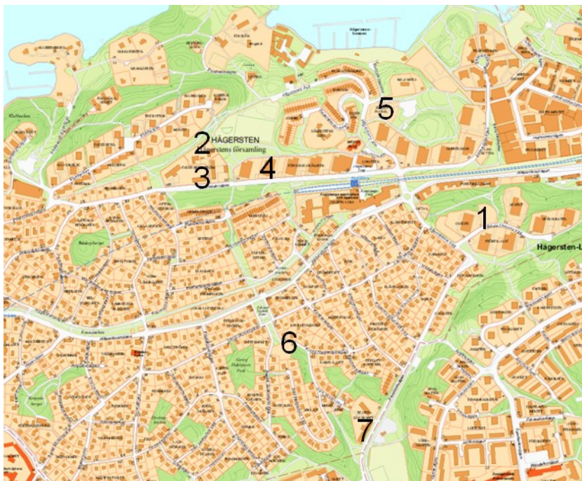
Karta 4: Projekt – Hägersten

I Hägersten kommer det att byggas 600 nya lägenheter under perioden. Denna bostadsutbyggnad kommer att täckas upp med fler förskolor som tillsammans ökar förskolekapaciteten från totalt 700 till 1000 platser.