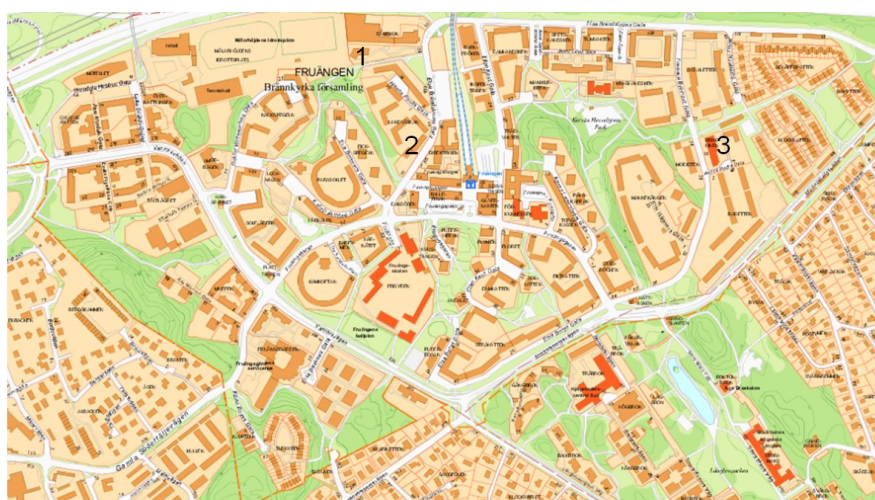
Karta 2: Projekt - Fruängen

30 lägenheter kommer att byggas i Fruängen under perioden. Inga nya förskolor planeras, men äldre förskolor kommer att ersättas med nya byggnader med plats för fler barngrupper. Under åren 2016-2021 berörs troligen förskolorna Elsa Brändström och Hanna Rydh. I ett senare skede kommer även Ellen Key att beröras. På grund av att de nya förskolorna behöver planändringar kommer det att vara underskott på platser i Fruängen under några år från 2018. Underskottet väntas kunna lösas med platser i angränsade stadsdelsområden.