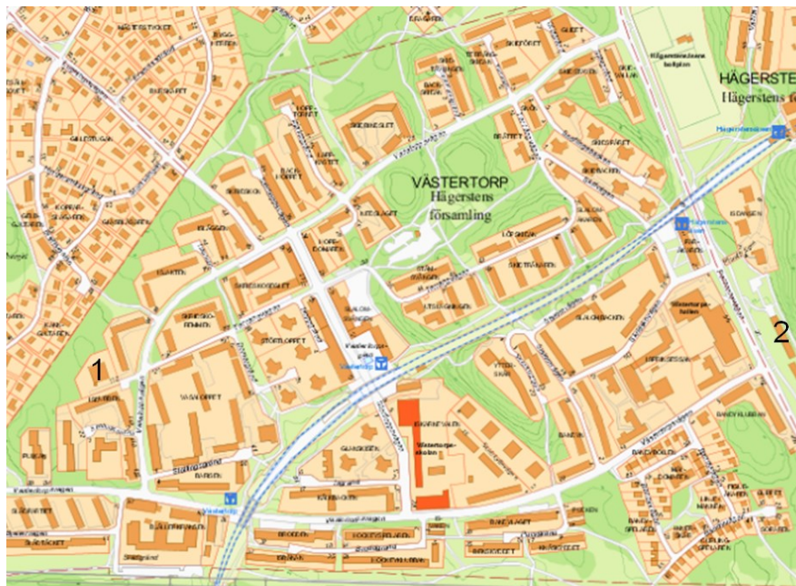
Karta 9: Projekt - Västertorp

I Västertorp kommer det att byggas 300 lägenheter under perioden. Denna bostadsutbyggnad kommer att täckas av de befintliga 500 förskoleplatserna som finns i området.