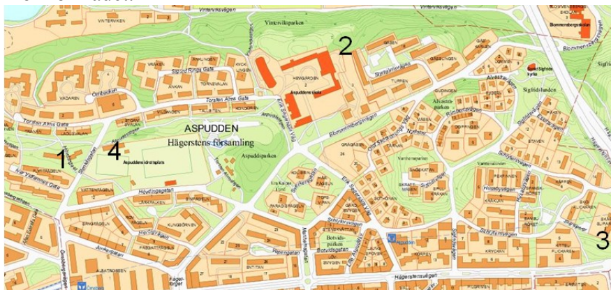
Karta 1: Projekt - Aspudden

I Aspudden kommer 350 bostäder att byggas under perioden. Samtidigt kommer förskolekapaciteten att öka ifrån 700 till 900 platser, vilket skapar ett visst manöverutrymme för lokalplaneringen inom området.