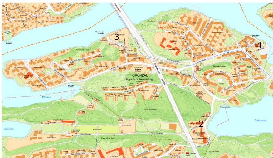
Karta 3: Projekt - Gröndal

I dagsläget finns ett litet underskott på förskoleplatser i Gröndal, som hanteras genom placeringar i närliggande områden. Efter 2017 väntas antalet förskolebarn i det befintliga bostadsbeståndet minska. Under perioden 2016-2021 kommer det byggas 450 nya lägenheter i Gröndal. En utökad förskolekapacitet ifrån 500 till 550 platser kommer täcka denna inflyttning.