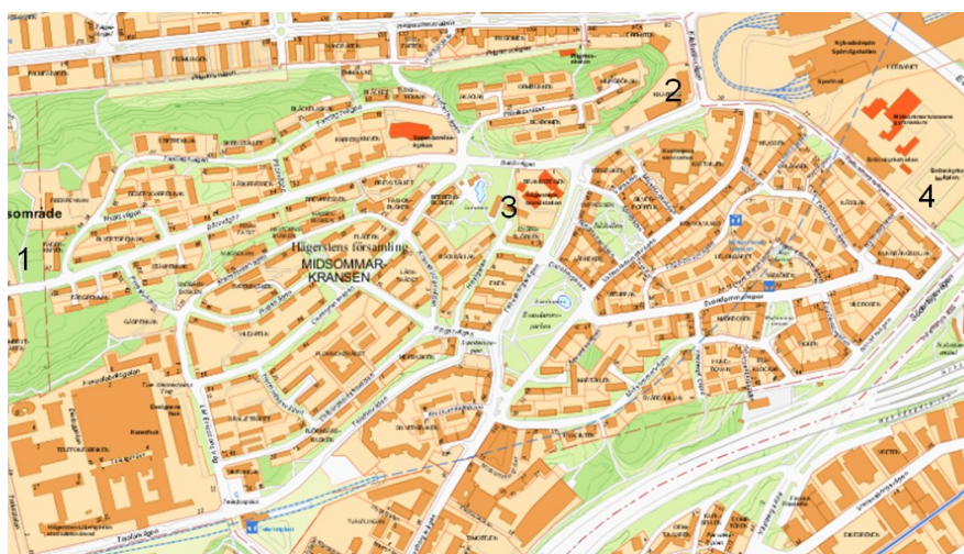
Karta 7: Projekt – Midsommarkransen

I Midsommarkransen kommer det att byggas 1 200 lägenheter under perioden. Denna bostadsutbyggnad kommer att täckas upp med fler förskolor som tillsammans ökar förskolekapaciteten ifrån 900 till 1100 platser.