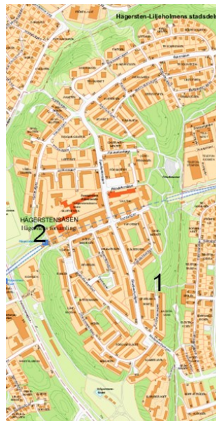
Karta 5: Projekt - Hägerstensåsen

På Hägerstensåsen kommer det att byggas 400 nya lägenheter under perioden. Denna bostadsutbyggnad kommer att täckas upp med två nya förskolor som tillsammans ökar förskolekapaciteten från 300 till 400 platser på Hägerstensåsen. Det täcker inte riktigt upp behovet, enligt prognosen saknas plaster på Hägerstensåsen. Stadsdelen klarar ändå garantin genom ett överskott i angränsande stadsdelsområden.