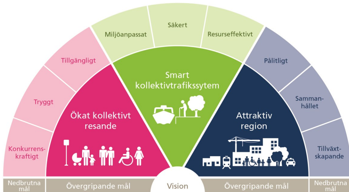
Trafikförsörjningsprogrammets målmodell, där visionen är ledstjärnan.