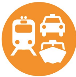
Trafikförvaltningen/ MÅLAB, SLL

De aktörer som har ansvar för ”hela resan” är följande: