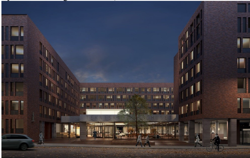
Visionsbild över ny entrébyggnad från Fleminggatan. Illustration: AIX arkitekter

Investeringsutgift är beräknad till 1 084 mnkr inklusive indexuppräknung. I denna investeringsutgift ingår inte möbler och inredning, vilken är beräknad till cirka 100 mnkr. Evakuerings- och flyttkostnaden ingår inte heller, den är beräknad till cirka 100 mnkr.