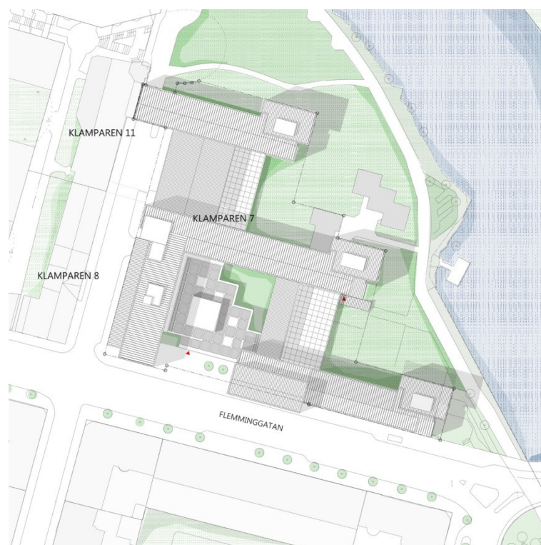
Illustration: AIX arkitekter

Energiutredningen kommer att uppdateras och en genomgripande analys för hela byggnaden kommer att genomföras med faktiska värden för energi och kostnader.