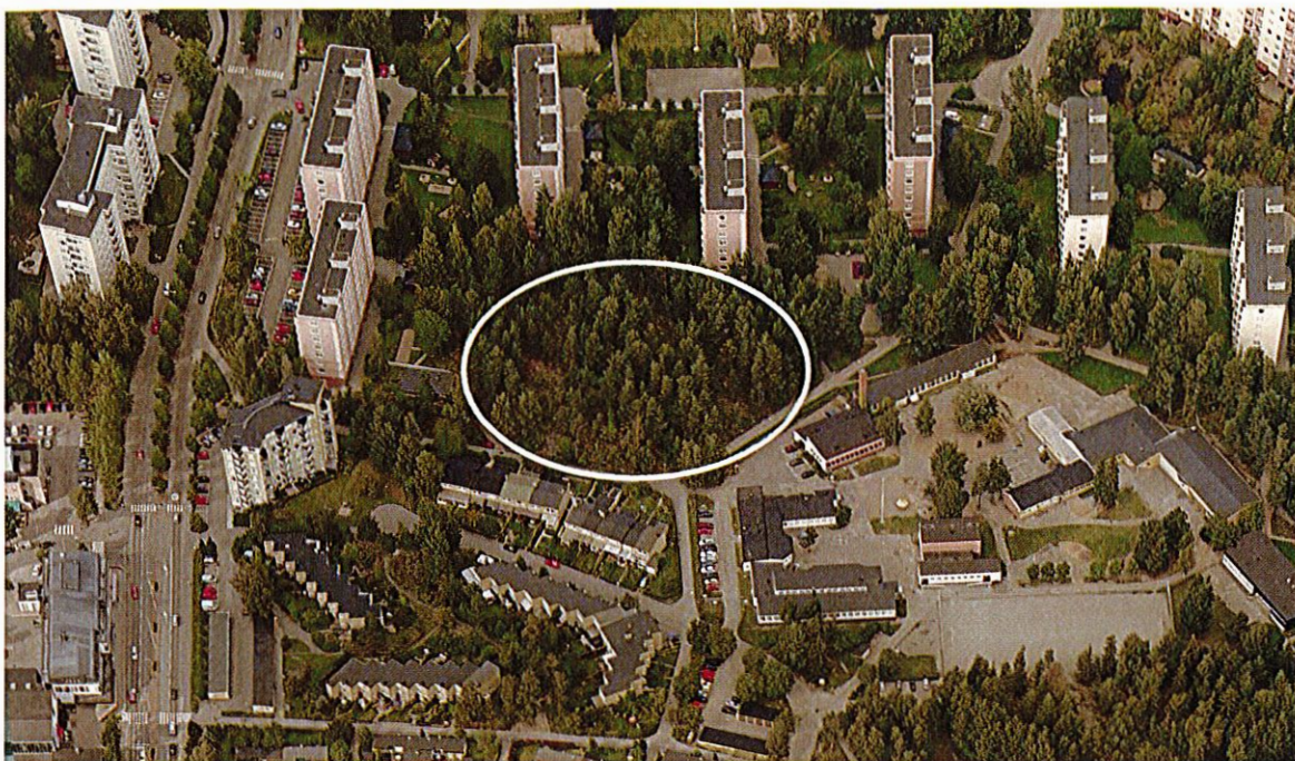
Planområdet, markerat med vitt, sett från söder.