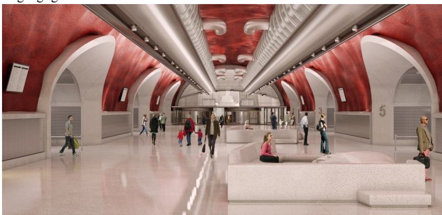
Bild 4: Illustration av vänthall, vy mot väster.

Via denna entré når man tunnelbanans södra perrongändar samt en koppling mellan Saltsjöbanan, tunnelbanan och bussterminalen. Ytterligare en entré finns vid kajplan intill Stadsgårdsleden, i Lokattens trappor. I samband med anordnandet av denna östra entré föreslås även att Lokattens trappor åter öppnas för allmän gångtrafik mellan Katarinavägen och Stadsgården. I och med detta föreslås också att en ny hiss uppförs för att säkra tillgängligheten mellan dessa två nivåer.