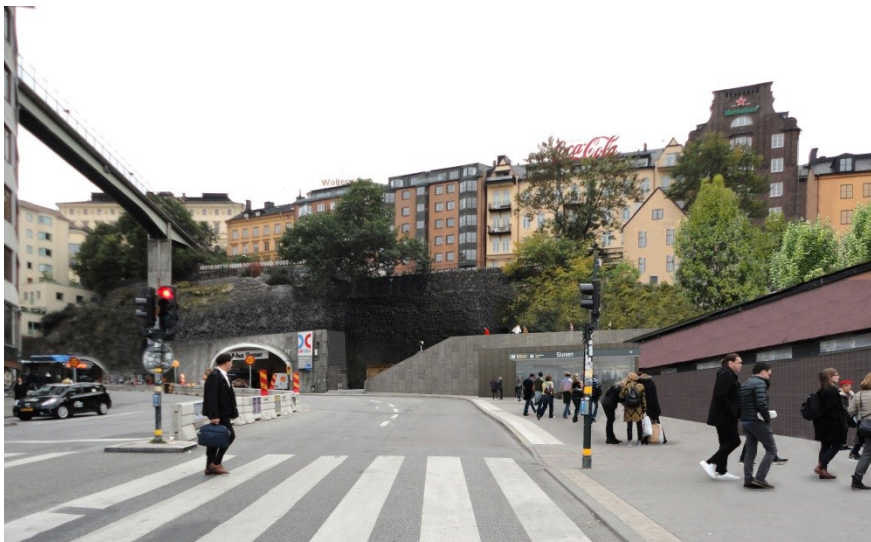
Bild 3: Illustration av ny entré vid Katarinavägen. Bild: Link arkitektur

I den tidigare planprocessen var det 8 ankomstplatser redovisat. Nu är det redovisat 6 ankomstplatser då det initialt är det behov som prognosierats. Det finns möjlighet att omvandla två reglerplatser till ankomstplatser så att det blir 8, ifall verksamhetsutövaren finner behovet i framtiden.