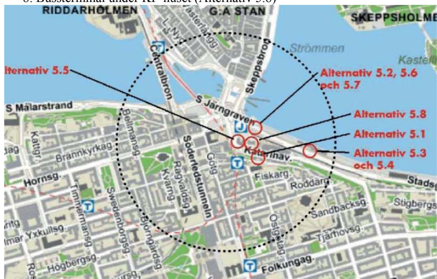
Bild 6: Alternativa lokaliseringar för bussterminalen.

Av alla jämförda alternativ är det bara Katarinaberget som ger tillräckligt utrymme att tillgodose kollektivtrafikens kapacitetsbehov i fråga om hållplatser.