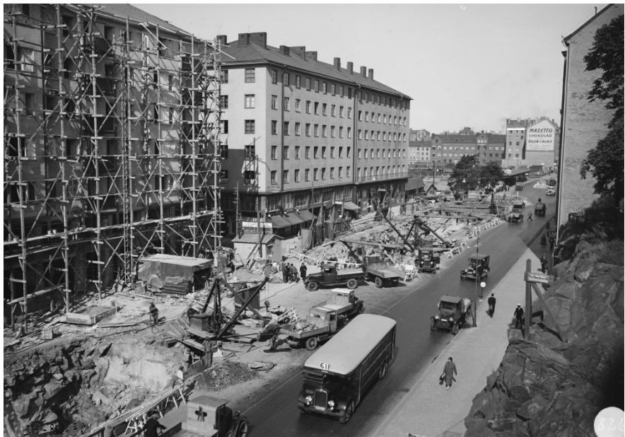
Götgatan under tunnelbyggnad, 26 /8 1932.

Under den aktuella sträckan av Götgatan ligger tunnelbanans gröna linje, som byggdes 1933 som en del av spårvägsnätet. Tunneln byggdes enligt ”cut-and-cover” metoden, dvs. ett schakt grävdes i gatan och ett nytt tak lades på för att skapa tunneltaket. Dagens Götgatan ligger på detta tunneltak, 1-3 meter över tunneln.