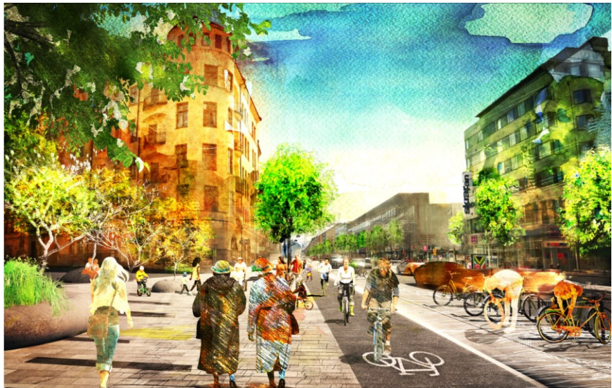
Visionsbild, (Illustration: Amanda Wahlén, Sweco Architects)

Nya träd planteras i en sammanhängande skelettjord och samordnas med nya sittplatser och cykelparkering i en möbleringszon. Träden kan ges en ny placering närmare gatans mitt vilket ytterligare skulle bidra till att trafikytornas dominans minskar. Träden får också bättre förutsättningar med moderna växtbäddar med möjlighet till lokalt omhändertagande av dagvatten. I samband med en större gatuomvandling kan hela gatan förses med ny beläggning och ny möblering. Vid behov justeras gatunivåerna och entréerna tillgänglighetsanpassas där det är möjligt.