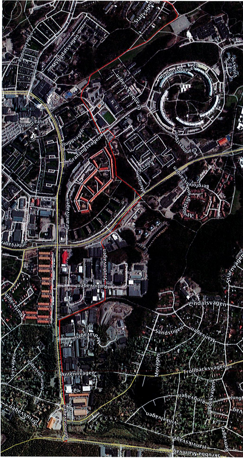
Bilaga 1 till samarbets- och markavtal mellan Tyresö Kommun och Eastern Light Sweden AB