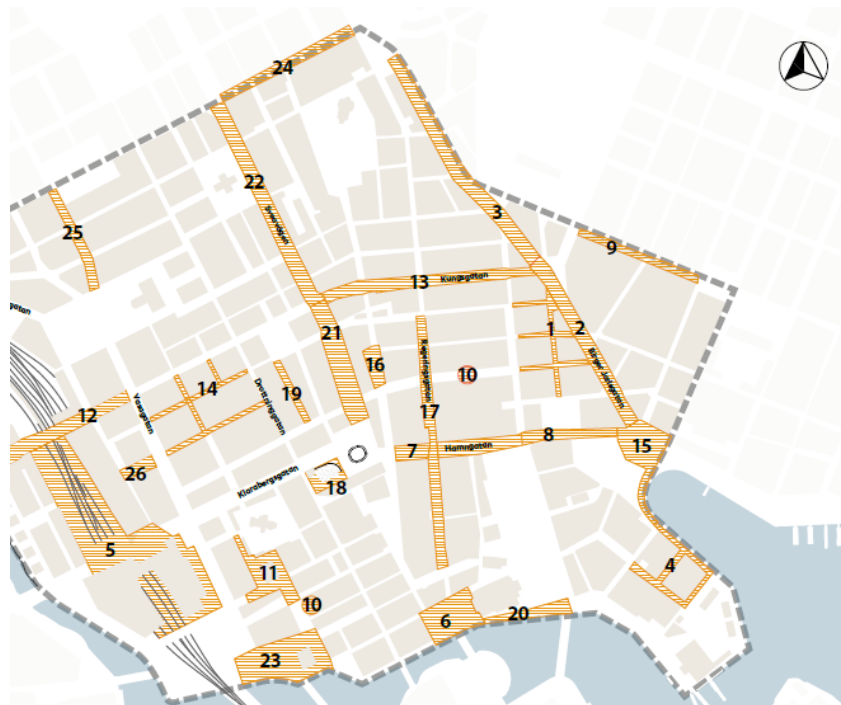
Karta över samtliga idéförslag för hur olika gator och platser skulle kunna förändras i City.

I Trafik- och gatumiljöplan för City presenteras ett också ett antal idéförslag om hur olika gator och platser skulle kunna förändras. Det är alltså inte färdiga förslag, utan ska endast betraktas som utkast och idéer. Det främsta syftet med remissen är att få synpunkter på dessa idéförslag.