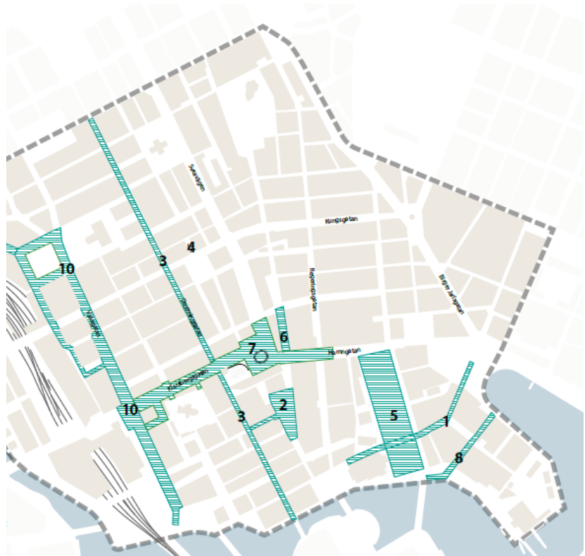
Karta över samliga pågående gatuombyggnads projekt i City.

Nedan följer en förteckning över pågående projekt och vilka mål de uppnår enligt planen.