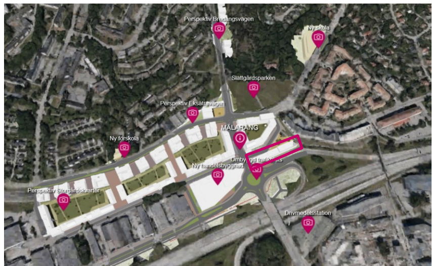
Mäläräng med aktuellt tilldelningsområde utmarkerat.

Detta ärende avser område C. Lägenheterna ska upplåtas med hyresrätt som ungdomslägenheter. Marken kommer att upplåtas med tomträtt.