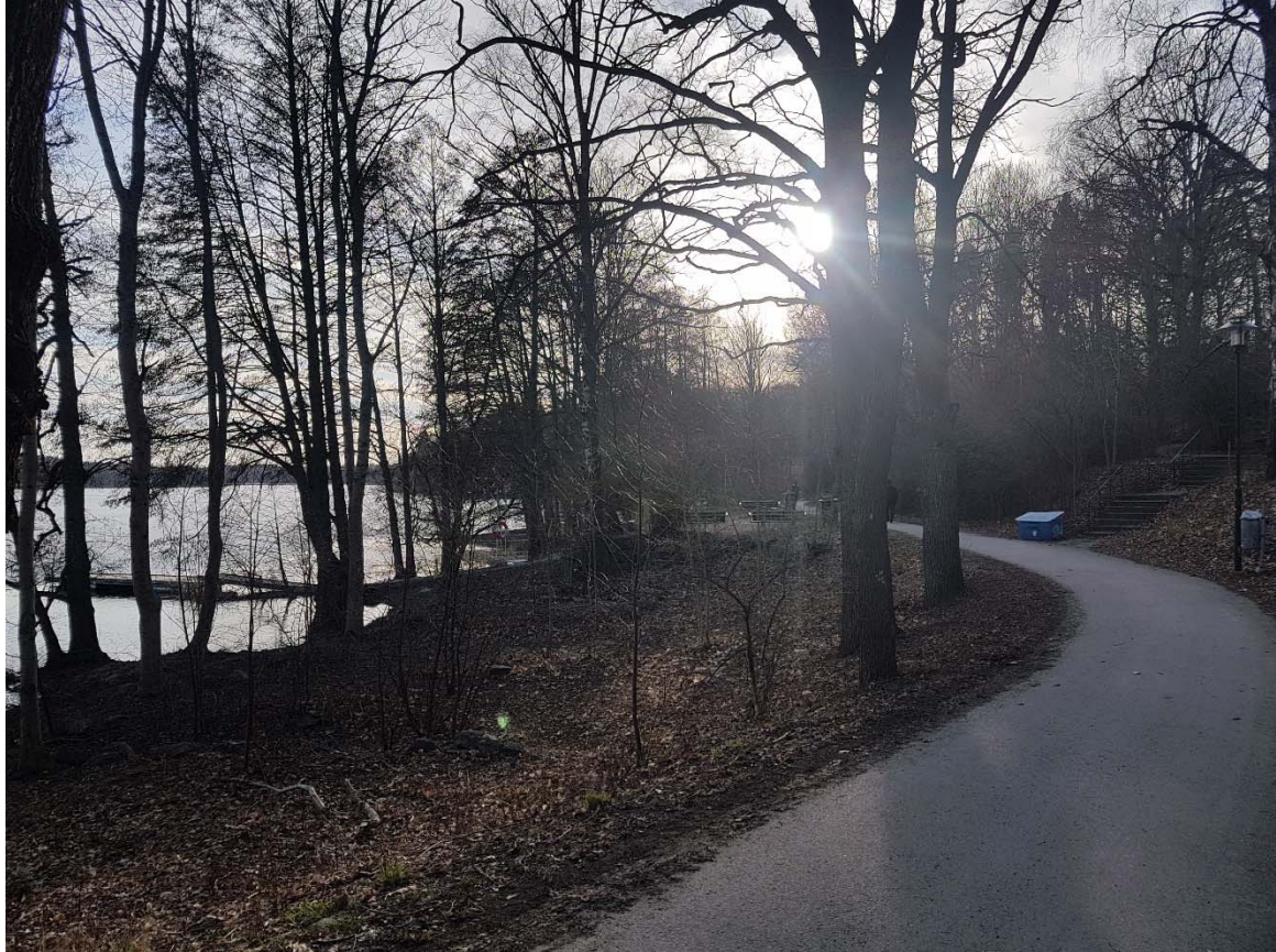
Nuvarande mötesplats som behöver rustas upp.