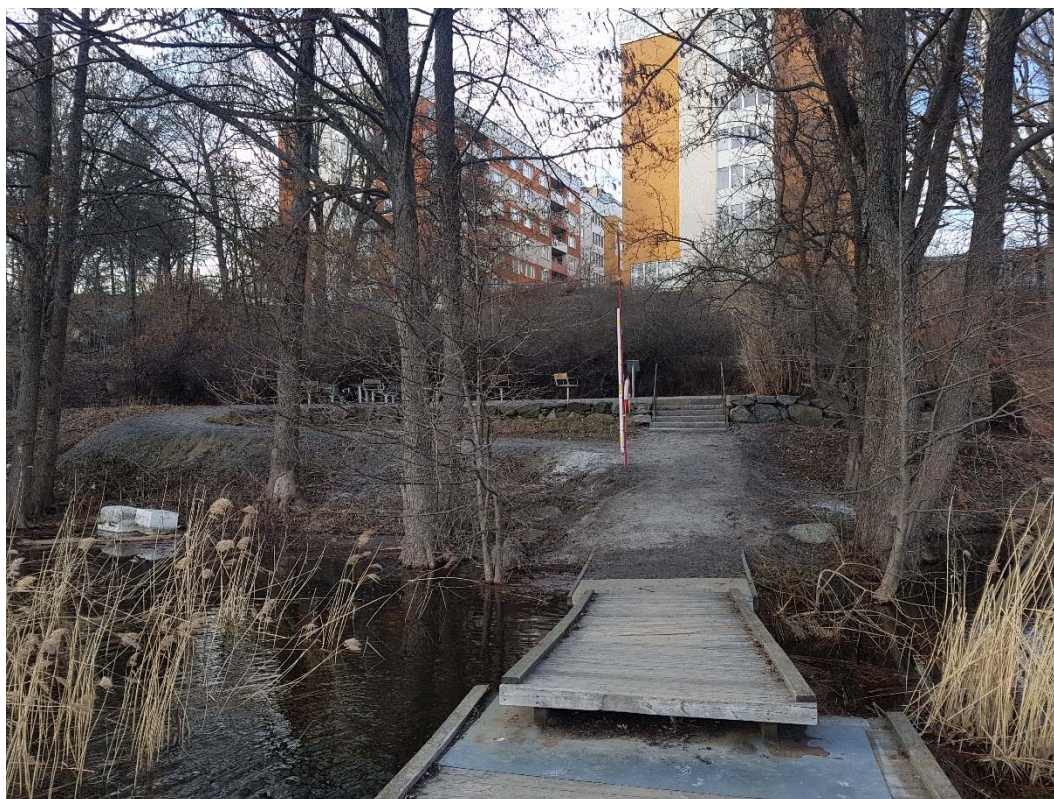
Nuvarande mötesplats som behöver rustas upp.