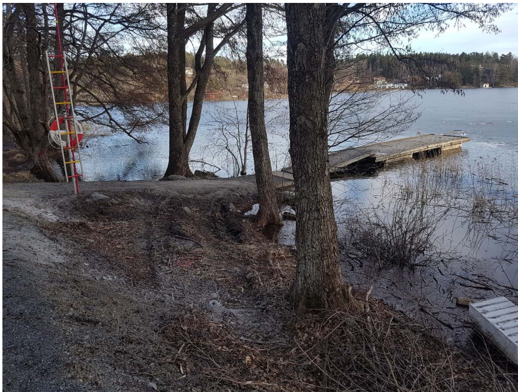
Nuvarande brygga som bör ersättas med en ny tillgänglighetsanpassad.