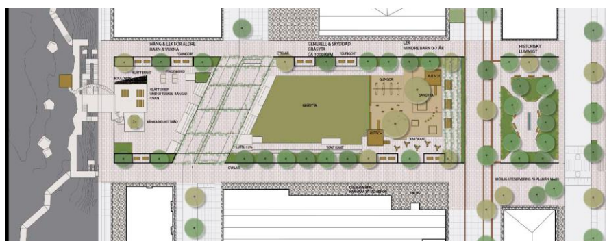
Illustration över Fållans olika delar, källa: samrådshandling för detaljplan S-Dp 2017-02397.

Fållan planeras att utvecklas som en park för rekreation och lek. Den historiska visuella kopplingen mellan bergväggen i väster och den centrala slaktanläggningar i öster återskapas. Parkens olika rum tydliggörs med inramning av träd och metallkonstruktioner. Förslaget innebär att den dramatiska bergskärningen i parken västra fond samt nivåskillnaden förstärks med plattformar i olika nivåer och bildar en unik vertikal park som binder samman Fållan och Naturparken. I västra delen planeras utkiksplattformar och aktivitetsytor för ungdomar och en lummig skogskaraktär där bergväggen lyfts fram bland annat med belysning. Plattformarna bildar ett tak med olika lekredskap och fallskydd under.