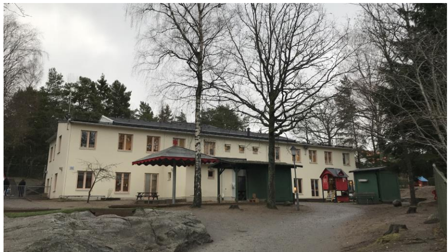
Befintlig förskola Skogsbacken, Ripsavägen 33

Den befintliga förskolan Skogsbacken, Ripsavägen 33 är uppförd i två våningar med totalt fyra avdelningar, tillagningskök och en förskolegård som består av kuperad naturmark med uppvuxna träd. Förskolan är belägen vid en mindre trafikerad stadsgata inom stadsdelen Högdalen ca 700 meter nordväst om Högdalens tunnelbanestation. Förskolan föreslås utöka med en avdelning till fem avdelningar i och med att köket tas bort. Förskolan totalrenoveras och förses med ny ventilation och det nuvarande värmesystemet med direktverkande el byts ut till bergvärme i samband med att borring görs för energibrunn, vilket förbättrar inomhusklimatet. Byggnadens brandskyddsklass höjs från BR2 till BR1.