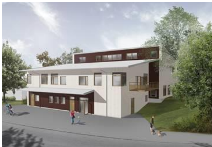
Förslag till ny förskolebyggnad längst Ripsavägen. Perspektiv från sydöst.

Den nya byggnaden uppförs i två våningar mot Ripsavägen och i souterräng genom halvplansförskjutningar mot gården. Den nya förskolebyggnaden delas upp i två volymer som förskjuts i sidled för att ge intrycket av en mindre kompakt byggnadsvolym med uppbruten karaktär. Halvplansförskjutningen anpassar dessutom byggnaden till terrängen genom att ta upp nivåskillnaderna mellan gata och gård.