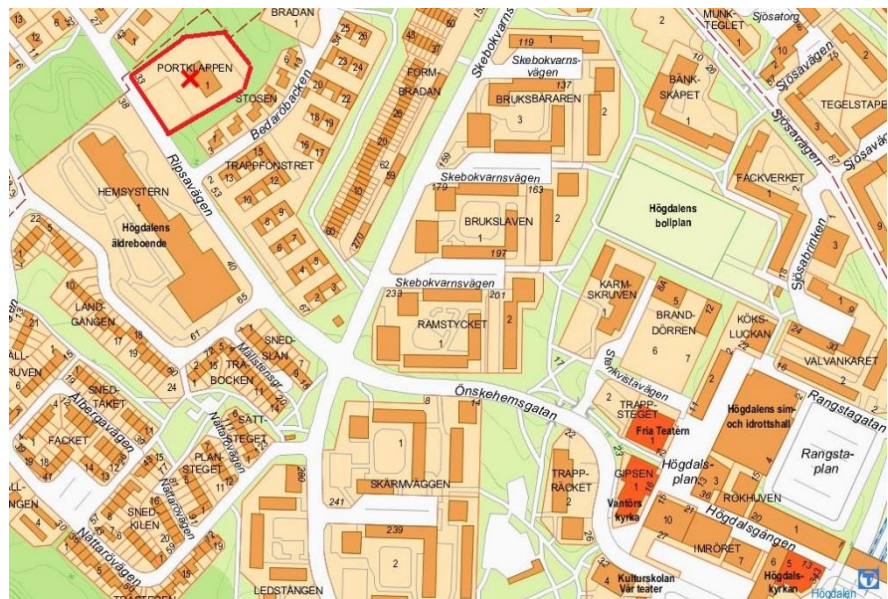
Befintlig förskola på Ripsavägen 33, inringad med kryss.

Den befintliga byggnaden har ett kulturhistoriskt värde och är grönklassad av Stadsmuseet vilket reglerar byggnadens exteriöra karaktär som ska beaktas och tillvaratas.