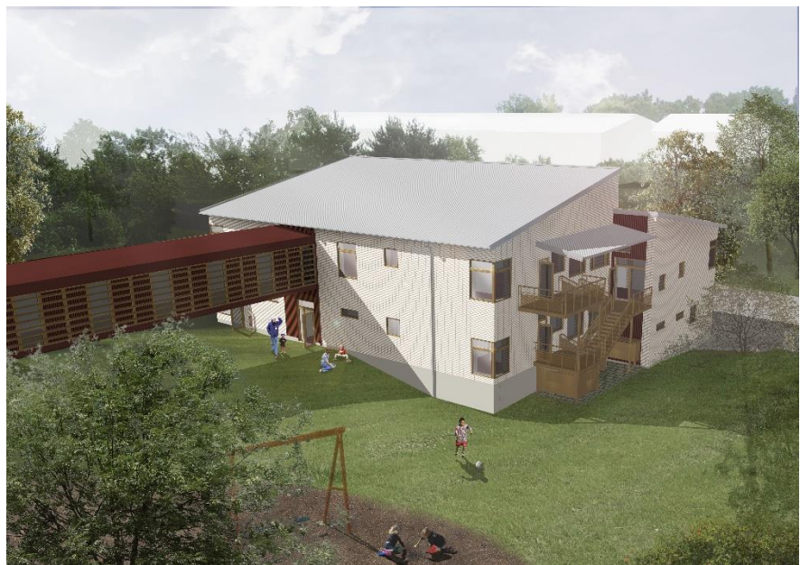
Gestaltning av förbindelselänken.

Förskolan får sammanlagt tio avdelningar med plats för 180 barn i funktionella och långsiktigt hållbara lokaler.