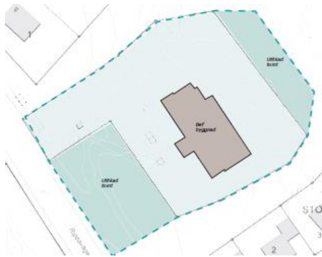
Förslag till utökning av förskolegården – mörkare blågröna ytor.

beräknas till totalt ca 4000 kvadratmeter vilket med tio avdelningar med 18 barn i varje avdelning motsvarar 22 kvadratmeter per barn. Förvaltningen bedömer gårdens yta som tillräcklig för att skapa goda möjligheter för höga lekvärden.