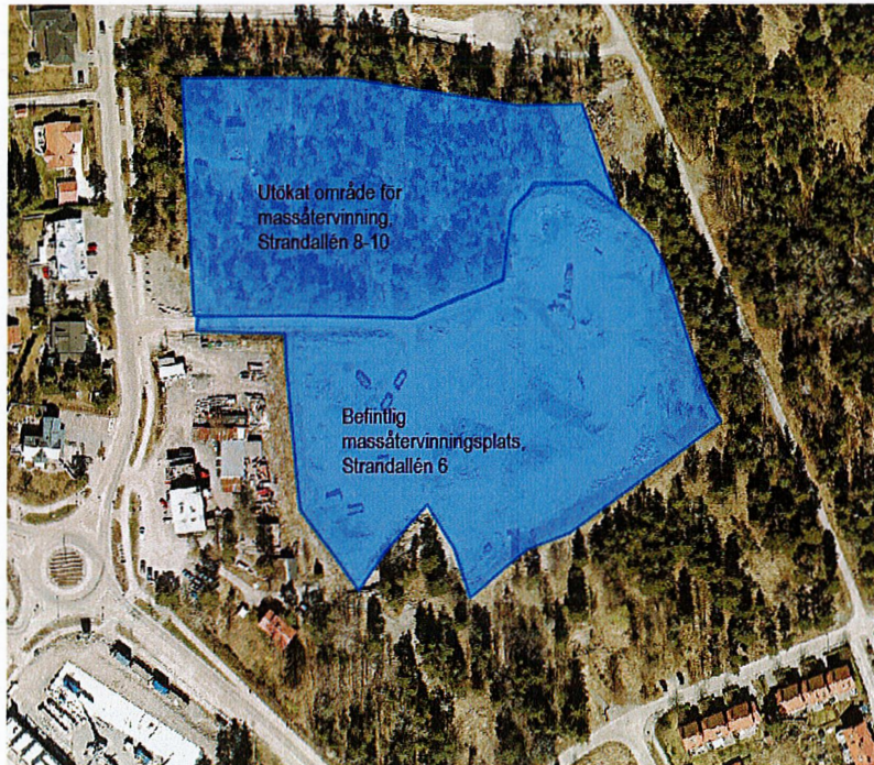
Massåtervinningsplats vid Strandallén, befintlig och utökad yta markerad med blått.

I augusti 2019 gavs kommundirektören uppdraget att upprätta en handlingsplan för genomförande av strategi för lokal masshantering på Östra Tyresö (KSM2019-833-260). Som en del av uppdraget ingick att ta fram en lokaliseringsutredning rörande massåtervinning på Strandallén 6 (Strand 1:390 m.fl.) samt på Strandallén 8- 10 (Strand 1:112 m.fl.). Även fastigheterna vid Slumnäsvägen 19-23 berörs och tas med i utredningen.