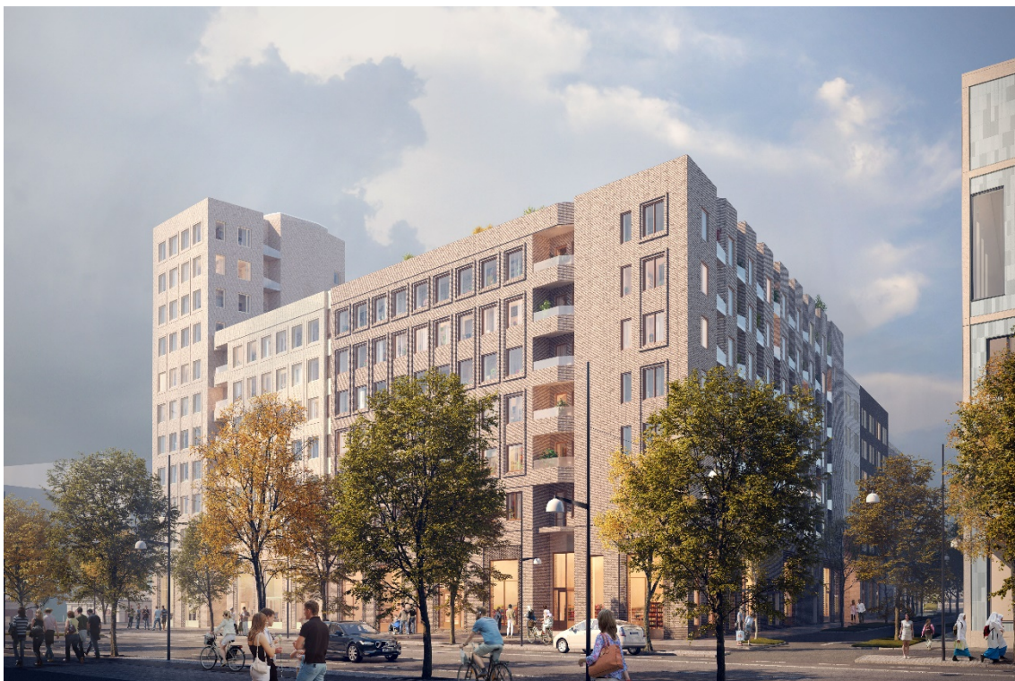
Svenska Bostäders föreslagna studentbostäder sett från Sveavägen med projektet mot norr. (Bild: Lindberg Stenberg Arkitekter)

Projektet har utsetts till pilot inom digitalisering i syfte att Svenska Bostäders resurser ska kunna användas mer effektivt samt att bidra till att uppnå våra verksamhetsmål. Exempel på detta är "smarta/uppkopplade hus", BIM som är digitala modeller av byggnadsverk i samhällsbyggandet, smarta lås, delningstjänster kopplat till hållbarhet och appar som på annat sätt förenklar boendet.