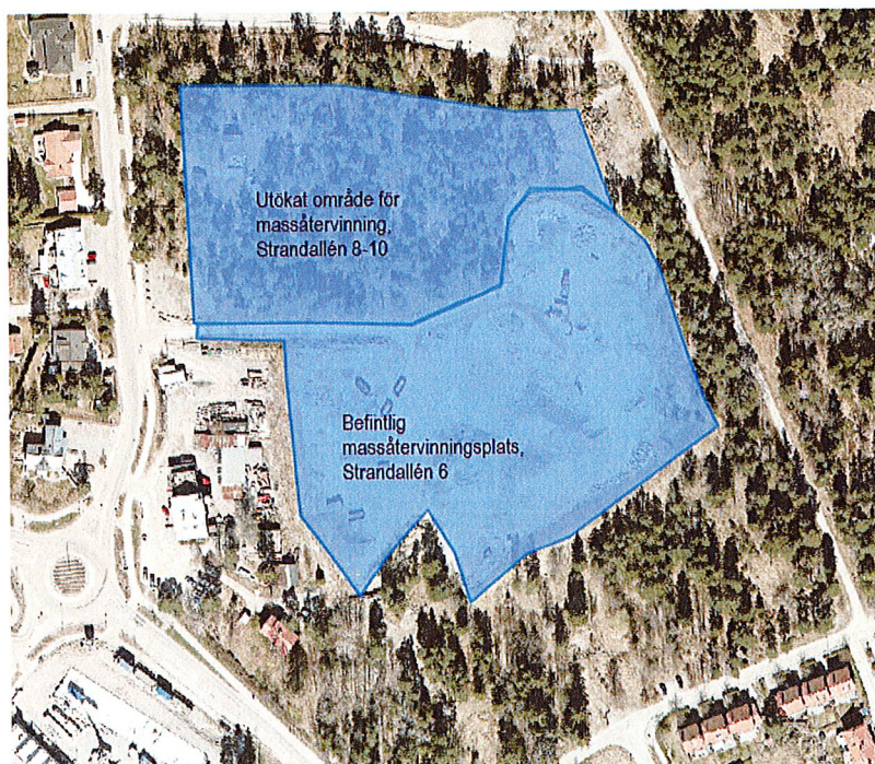
Massåtervinningsplats vid Strandallén, befintlig och utökad yta markerad med blått.

I augusti 2019 gavs kommundirektören uppdraget att upprätta en handlingsplan för genomförande av strategi för lokal masshantering på Östra Tyresö (KSM2019-833-260). Som en del av uppdraget ingick att ta fram en lokaliseringsutredning rörande massåtervinning på Strandallén 6 (Strand 1:390 m.fl.) samt på Strandallén 8- 12 (Strand 1:112 m.fl.). Även fastigheterna vid Slumnäsvägen 19-23 berörs och tas med i utredningen.