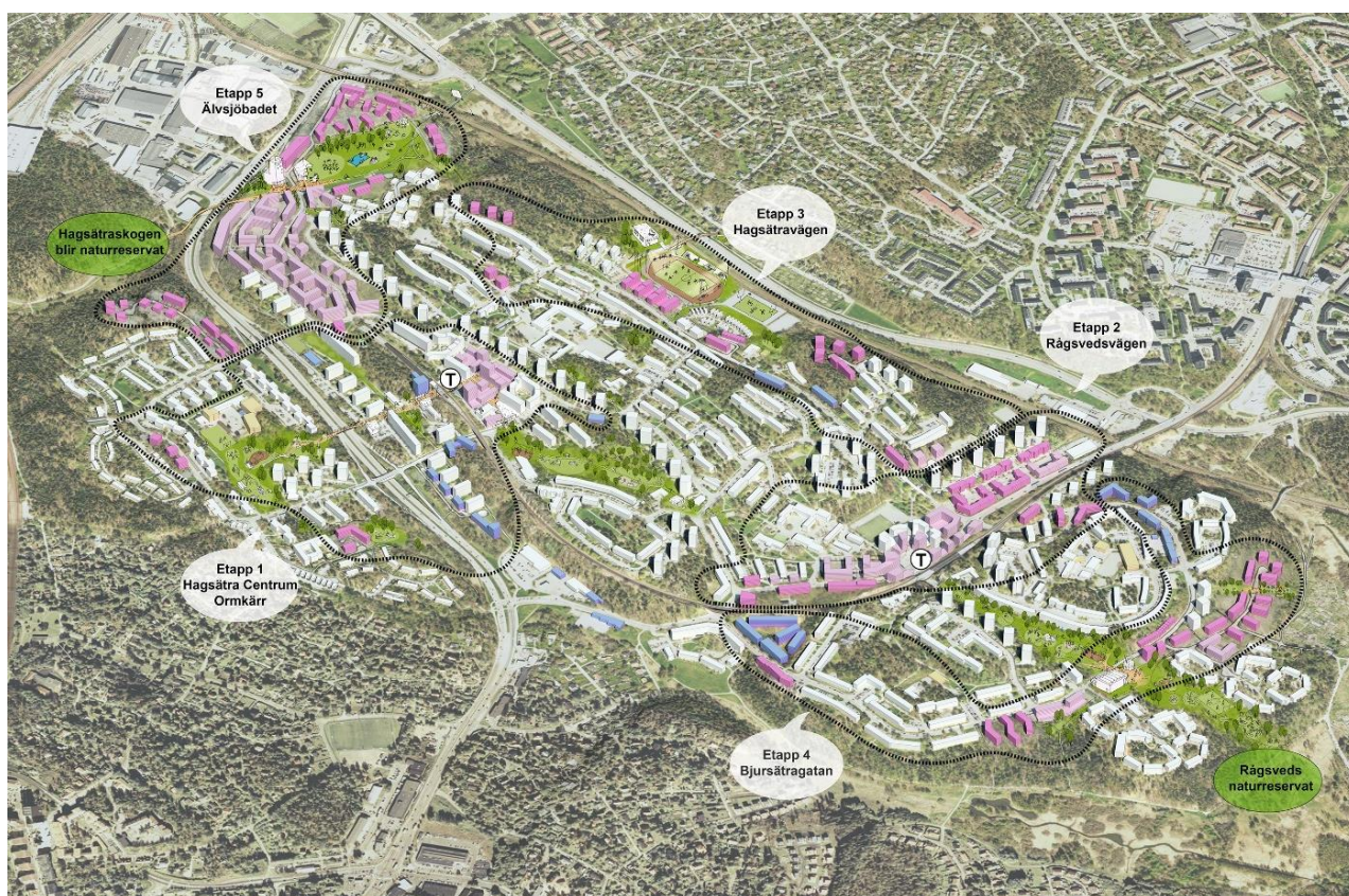
Bild: Översiktsillustration Fokus Hagsätra-Rågsved. Blå byggnader visar pågående projekt.

Kontoren föreslår vissa revideringar utifrån samrådssynpunkterna, områdets ekologiska kärnvärden samt att det i planeringen för Fokus Hagsätra Rågsved framkommit vikten av att stärka både rekreativa samband och spridningssamband samtidigt som relativt omfattande ny bebyggelse möjliggörs i andra gröna samband.