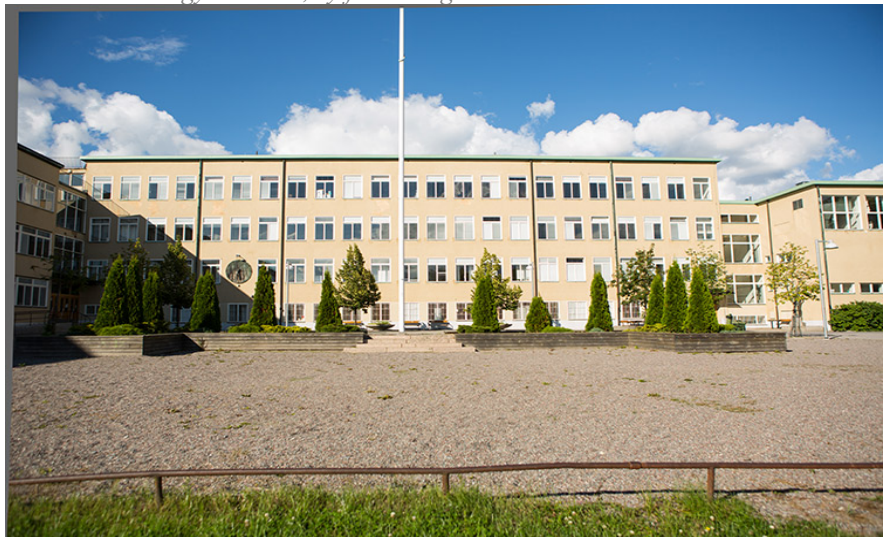
Bild 1. Bromma gymnasium, vy från skolgården.

Bromma gymnasium är Stockholms äldsta gymnasieskola utanför tullarna. Det är beläget i ett lugnt område vid Stora Mossen, intill koloniträdgårdar och en stor idrottsplats. Bromma gymnasium bedriver utbildningar inom samhällsvetenskap, naturvetenskap, ekonomi och teknik. Det finns även språkintrouktion och nationellt idrottsprogram på skolan. Gymnasiet är populärt och får bra omdömen i utvärderingar – både nuvarande och tidigare elever tycker att utbildningarna håller hög kvalitet. Lärare och elever trivs på skolan.