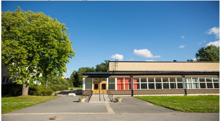
Bild 4. Matsalen på Bromma gymnasium.

Matsalen byggs ut för att utöka kapaciteten från dagens 212 personer till 412 personer efter utbyggnad. Detta avser teknisk kapacitet, som avgörs av bland annat ventilationen. I dagsläget används matsalen av fler elever än vad ventilationen är dimensionerad för. Entrén till matsalen byggs om för att klara av fler elever och skapa bättre flöden vid in- och utpassering. Matsalen byggs ut mot skolgårdssidan.