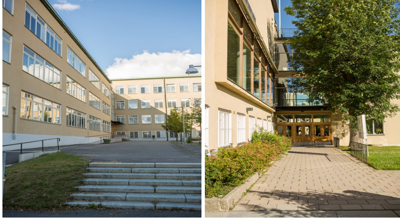
Bild 2. Exteriör och entré på Bromma gymnasium.

Bromma gymnasium har i dagsläget kapacitet för cirka 1 100 elever. Matsalen är idag en trång sektor. Om den inte byggs ut kommer förvaltningen på sikt att behöva justera ner skolans kapacitet.