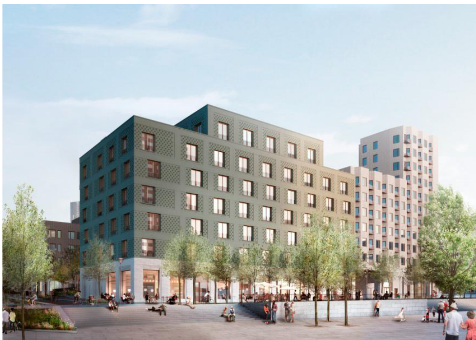
Gestaltningsskiss Micasa Fastigheters vård- och omsorgsboende

takterrass. Både gemensamhetslokalen och takterrassen får vyer över nationalstadsparken och Brunnsviken. Plan 8 innehåller även personalytor. På bottenplan når man vård- och omsorgsboendets gård. Den gröna gården öppnar sig mot en parkyta i norr. Bottenplan innehåller även förråd, teknikytor och cykelrum för personal. På bottenplan ligger också en dagverksamhet för demenssjuka och kommersiella/publika ytor åt Tullhusplatsen. Ett källarplan under del av byggnaden innehåller merparten av teknikytor samt lägenhetsförråd för de boende.