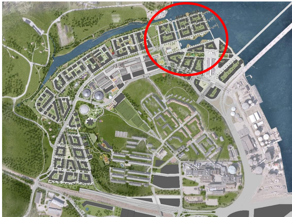
Norra Djurgårdsstaden och Hjorthagen, planöversikt. Kolkajen markerat.

Kärnhem har sedan tidigare markanvisats ”Södra Kanalkvarteret” inom Kolkajen för 165 lägenheter. Totalt markanvisades Kärnhem 350 lägenheter under 2019, 165 lägenheter inom Kolkajen och ytterligare 185 lägenheter inom Årstafältet.