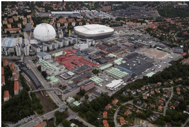
Slakthusområdet och Globenområdet år 2019.

Slakthusområdet ska bli en blandstad med ledorden kultur, mat och nöjen och planeras nu för att innehålla cirka 3 000 nya bostäder, cirka 14 000 arbetsplatser samt ytterligare ytor för verksamheter och handel. Planering och projektmål för Slakthusområdet följer översiktsplanen, Vision Söderstaden och planprogrammet från 2017 och medverkar till att uppfylla de årliga budgetarna. Med anledning av målen om ökade arbetsplatser i Söderort planerar projektet nu för mer arbetsplatser i Slakthusområdet än vid tidigare inriktningsbeslut då det var cirka 10 000 arbetsplatser och 4000 bostäder.