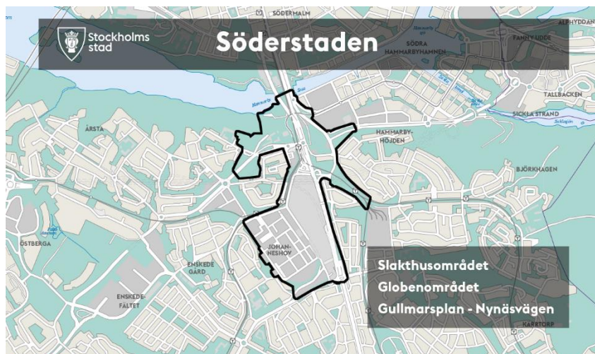
Söderstadens geografiska avgränsning.

Projektet Söderstadens avgränsning har justerats under år 2020. De södra delarna av Skanstull ingår inte längre i projektområdet Söderstaden. Söderstaden består nu därmed av Slakthusområdet, arenaområdet kring Globen samt Gullmarsplan-Nynäsvägen, se bild nedan. Dock kvarstår inriktningen att koppla samman Söder och Södermalm.