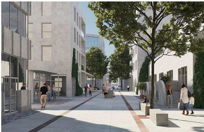
Visionsbild för Livdjursgatans förlängning.

Etapp 1 är belägen i områdets västra del. Etapp 1 är föremål för genomförandebeslut i exploateringsnämnden samordnat med detta reviderade inriktningsbeslut för Slakthusområdets helhet. Se vidare sidan 18.