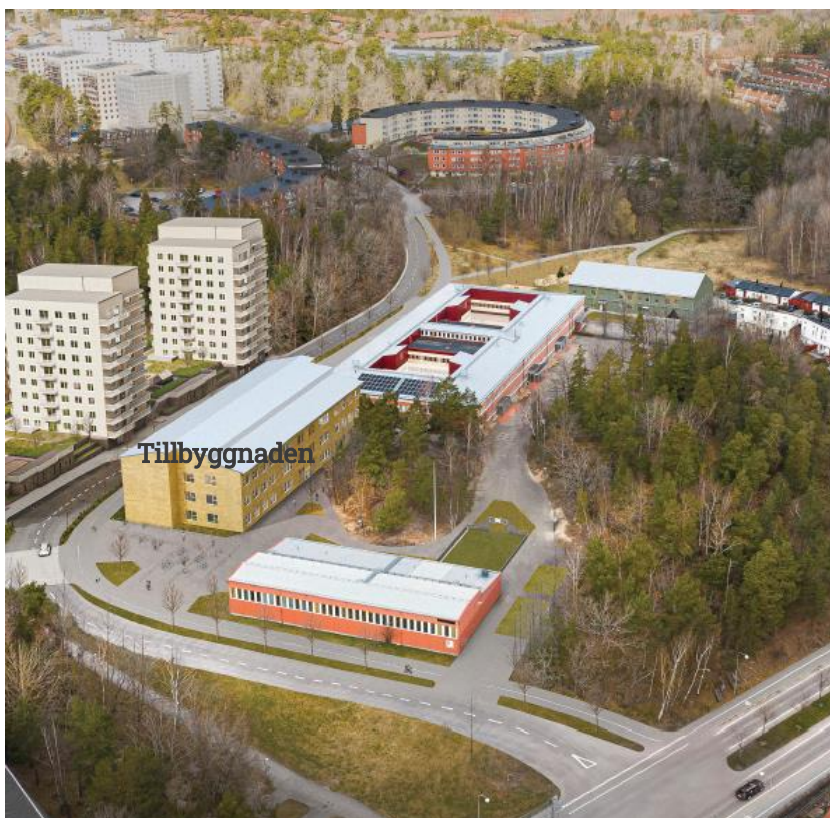
Skiss av Kvikentorpsskolan inklusive tillbyggnaden.

Även idrottsbyggnaden om ca 900 kvm BRA byggs om för att göra plats för åtta omklädningsrum. Befintliga salar renoveras under 2020. Idrottsbyggnad renoveras också delvis avseende installationer. Teknikrummet flyttas till taket med anledning av att större yta behövs för aggregat. Idrottsbyggnaden ska göras möjlig att hyra ut.