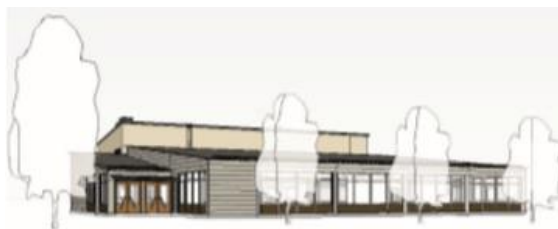
Bild 2: Gestaltning av tillbyggnad på matsal.