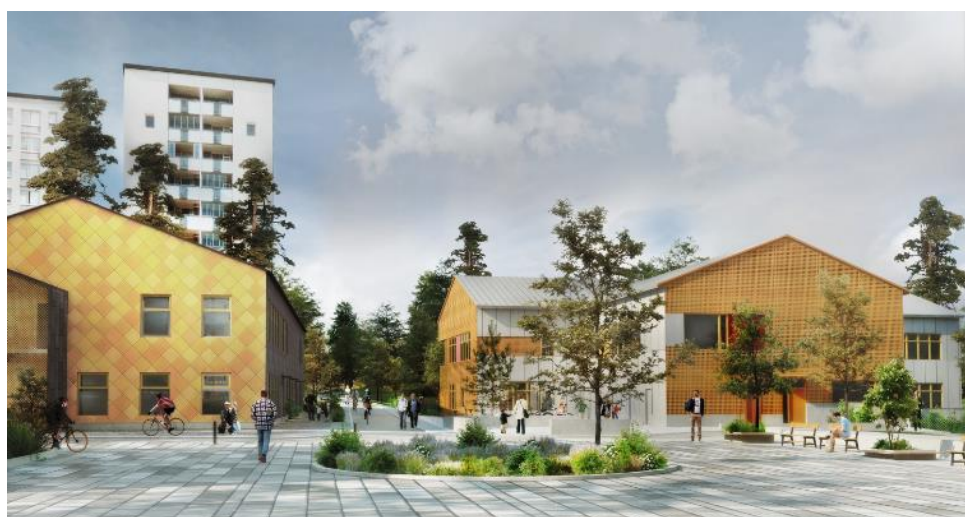
Sett från Sunneplan, den t-formade förskolan på Hästhagens bollplan till höger samt förskolan Rindö 1 till vänster