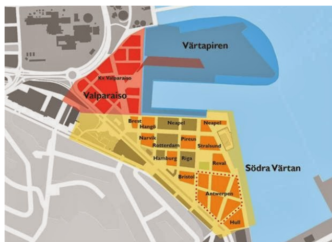
Figur 1 - Karta över södra Värtanområdet.

Södra Värtan utgör tillsammans med Valparaiso och Värtapiren delområdet Värtahamnen. Planerna för att bygga ut Värtahamnen innebär bland annat att befintlig infrastruktur inom området i stora delar behöver ersättas, förorenade markområden behöver saneras samt byggnader och anläggningar restaureras.