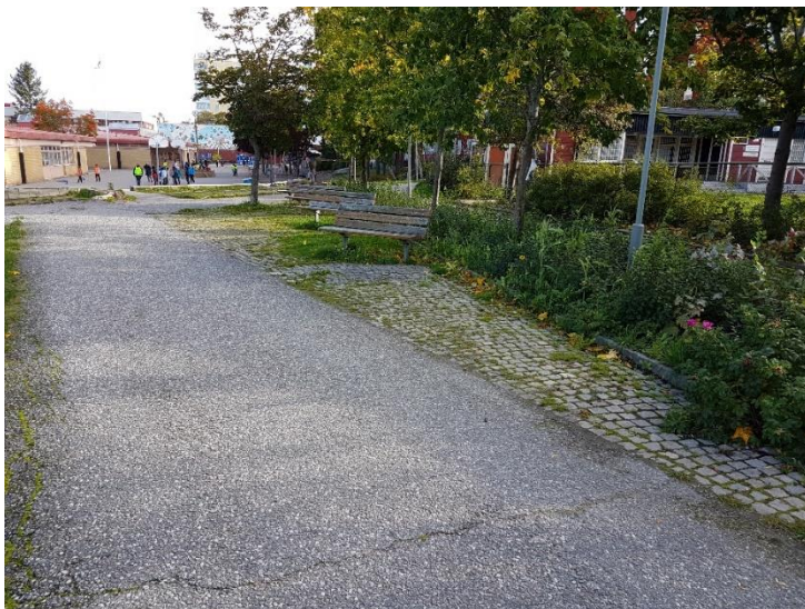
Bild 1 Gångstråk idag, dagtid

Stora delar av grönstråket upplevs idag som skräpiga, mörka och otrygga. Det finns nästan inga platser som lockar till vistelse.