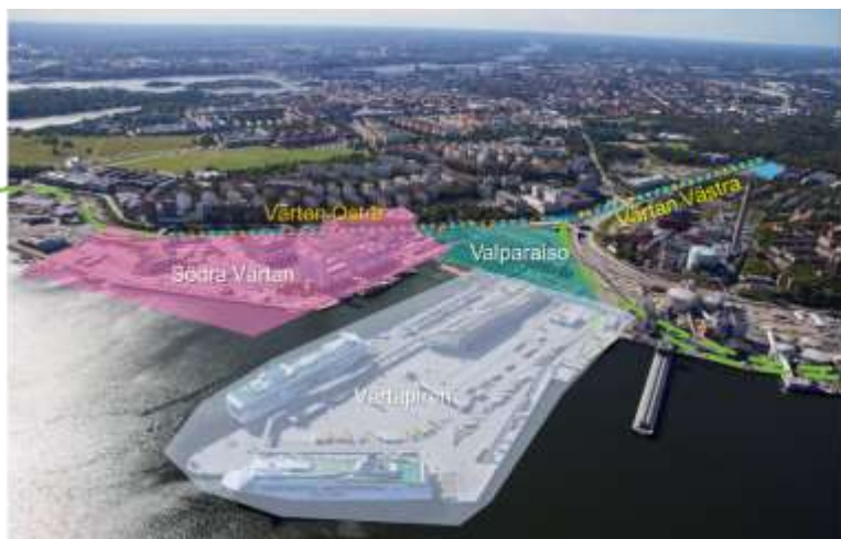
Översikt över Värtabanans Östra och Västra bangård

Bangården utgör idag en barriär mellan Gärdet och den nya stadsdelen i Värtahamnen. Inom den yta där Östra bangården ligger idag planeras Södra Hamnvägen breddas för att kunna hantera god framkomlighet för gång, cykel, kollektivtrafik och kapacitet att stundtals klara stora flöden av fordon till och från Frihamnen.