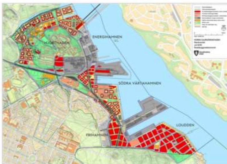
Stadsutvecklingsområdet Norra Djurgårdsstaden.

Norra Djurgårdsstaden är ett stadsutvecklingsområde där det planeras minst 12 000 nya bostäder och ca 35 000 nya arbetsplatser. Inom stadsutvecklingsområdet ligger Värtahamnen, som tidigare har kallats Södra Värtahamnen. Det består i sin tur av totalt tre delområden Södra Värtan, Valparaiso och Värtapiren som tillsammans omsluter en hamnbassäng. Delområdena utgör tre egna projekt som har enskilda inriktningsbeslut. Projektens totalekonomi (total budget för Värtahamnen) har redovisats vid tre tidigare beslutstillfällen.