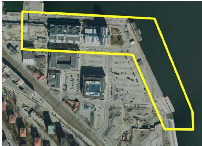
Befintligt område som ingår Södra Värtans Norra del, Detaljplan för Neapel 3 mfl i stadsdelen Ladugårdsgärdet