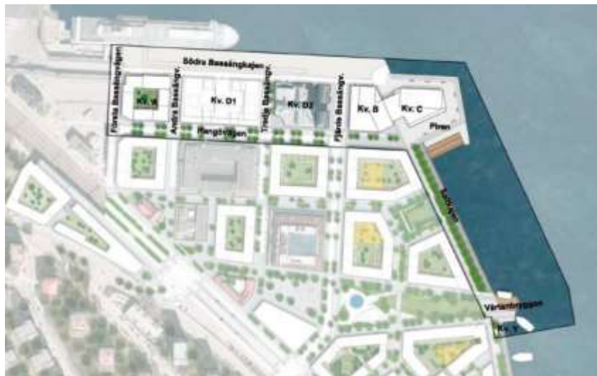
Illustrationsplan över utbyggt planområde med ungefärlig avgränsning.

Den pågående hamnverksamheten i Värtahamnen medför verksamhetsbuller och för att möjliggöra den planerade bebyggelsen för samtliga etapper i Södra Värtan behöver bullret skärmas av norrifrån vilket är ett av motiven till att bygga högre byggnadsvolymer mot norr. I planområdets östra del tillskapas ny landmassa med hjälp av konstruktioner och utfyllnad i vattnet. Denna benämns Saltpiren och delar av en byggnaden benämnd Pirhuset planeras att byggas här. Utbyggnad av Saltpiren och Pirhuset är en viktig förutsättning för kommande etapper eftersom den avskärmar verksamhetsbuller från de yttre, östra delarna av Värtapiren i Värtahamnen och möjliggör därmed kommande bostadsbebyggelse och skola i Södra Värtan. Söder om Pirhuset föreslås ett torg med trappor ner mot vattnet. Längst östra kajlinjen föreslås ett promenadstråk ner mot Värtanbryggan som kommer vara utgångspunkt för kollektivtrafik till sjöss. Söder om Värtanbryggan ska en teknikbyggnad uppföras för VA-ändamål.