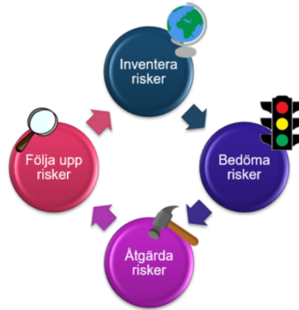
Bild 2.0. Grundläggande modell för riskhantering

Samverkan är en viktig del av riskhanteringen. Riskhanteringen är en del i kommunens planering och uppföljning och bidrar till att verksamheten når sina mål, se Tyresö kommuns plan för styrning, planering och uppföljning 3 . Det bidrar även till att informationen och rapporteringen om verksamheten och ekonomin är tillförlitlig och rättvisande samt att verksamheten efterlever lagar, regler, avtal med mera.