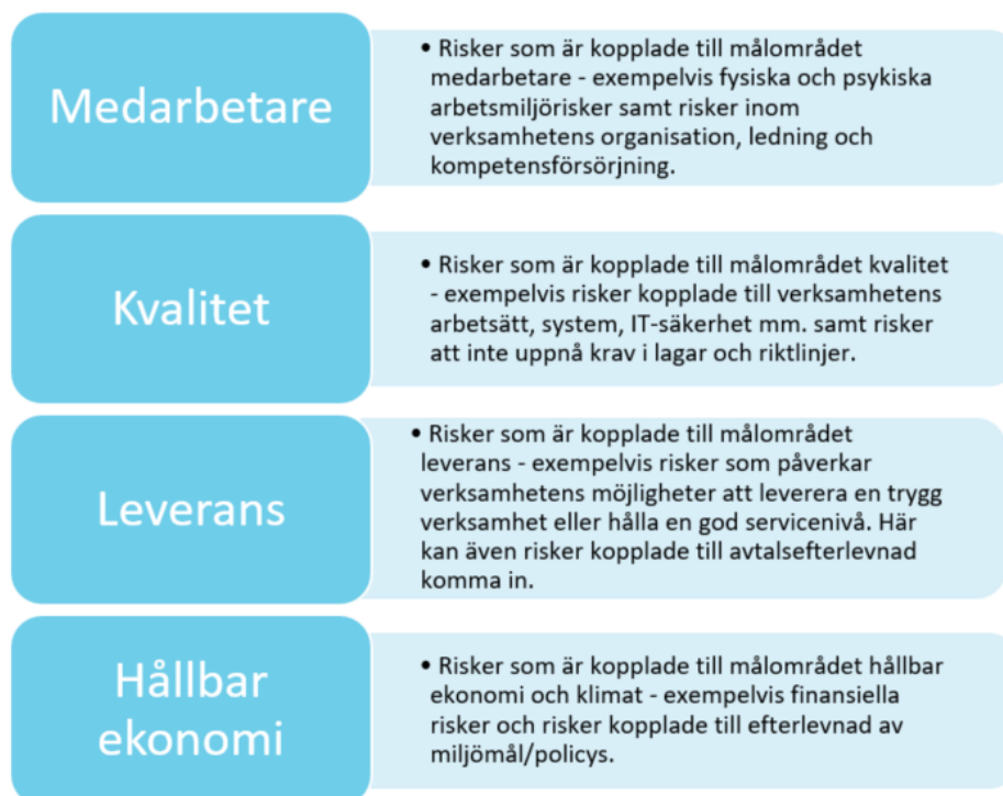
Bild 3.1.1. Riskkategorierna kommenterade per kommunens målområden

Samtliga kategorier kan innefatta både strategiska omvärldsrisker och operativa verksamhetsrisker – det är målområdet som risken främst utgör ett hot inom som avgör kategoriseringen.