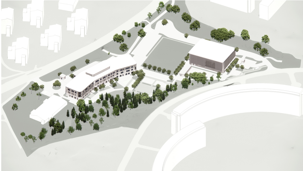
Figur 2. Översiktlig illustration över planerat skolområdet. Detaljerad utformning är under utredning. (AIX Arkitekter)

En omsorgsfullt utformad skolmiljö kan bidra till positiva synergieffekter för området. Bedömningen är att planförslaget skapar förutsättningar för detta.