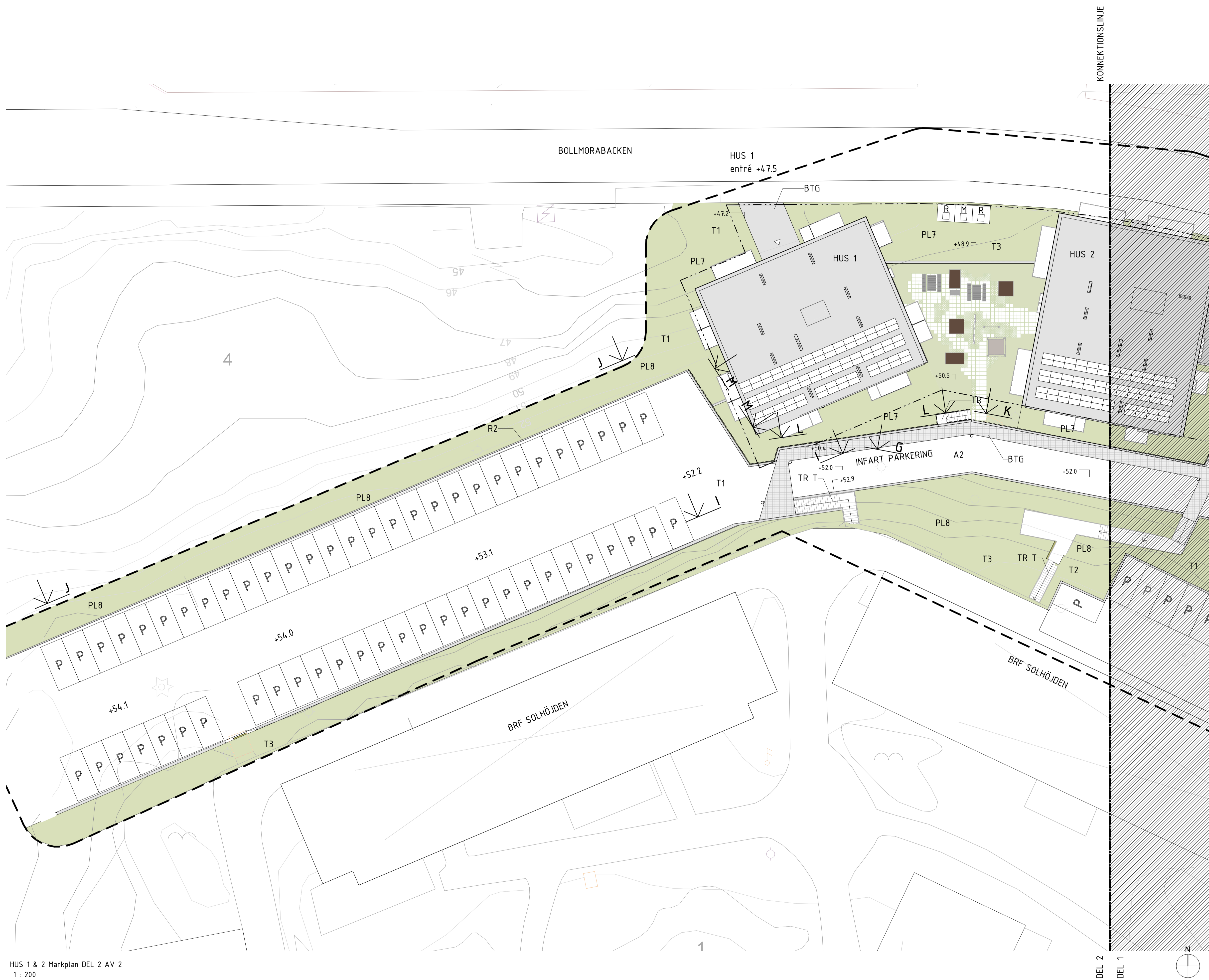
HUS 1 & 2 Markplan DEL 2 AV 2 1 : 200