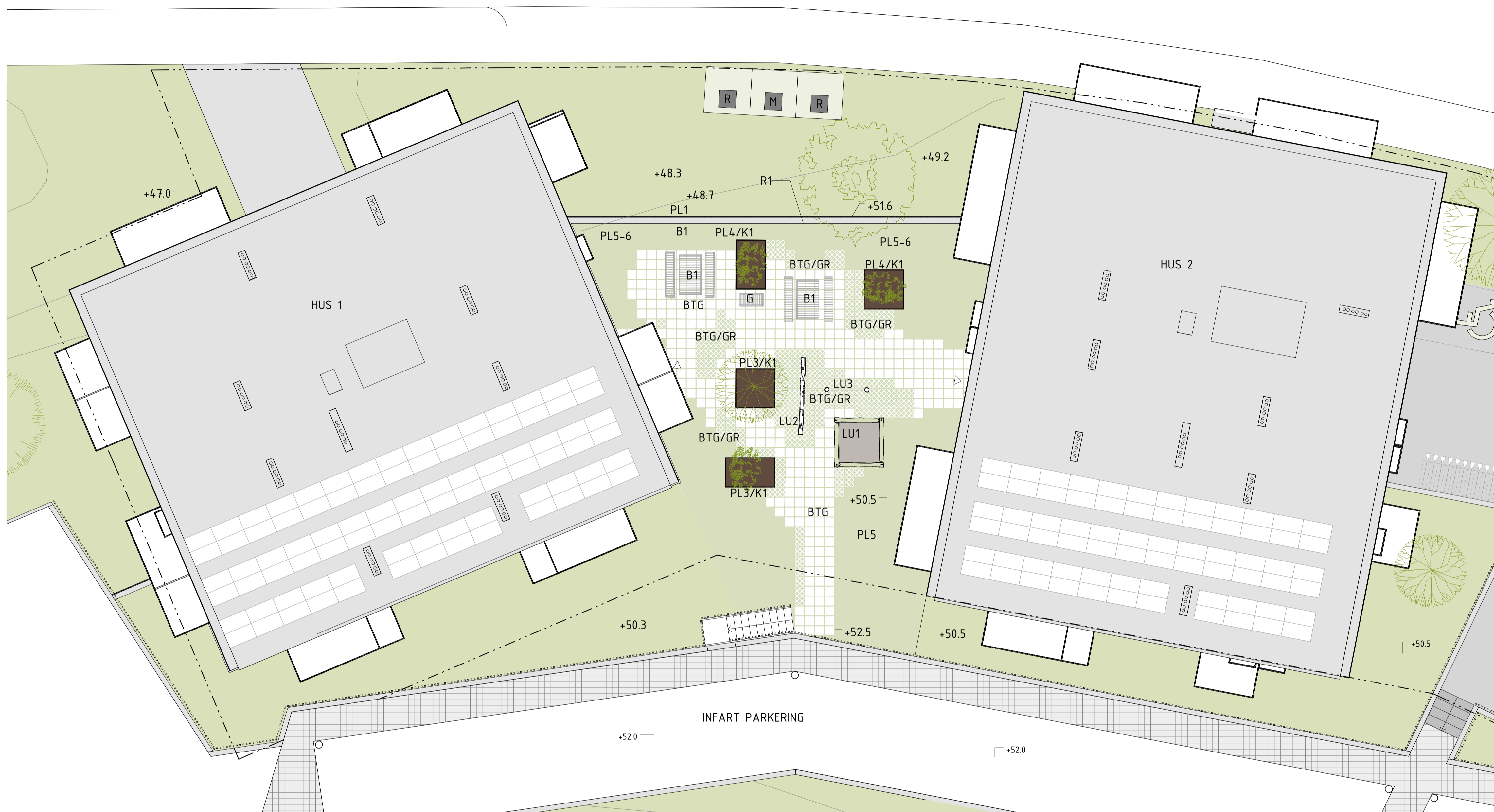
HUS 1 & 2 MARKPLANERING GÅRD 1 : 100